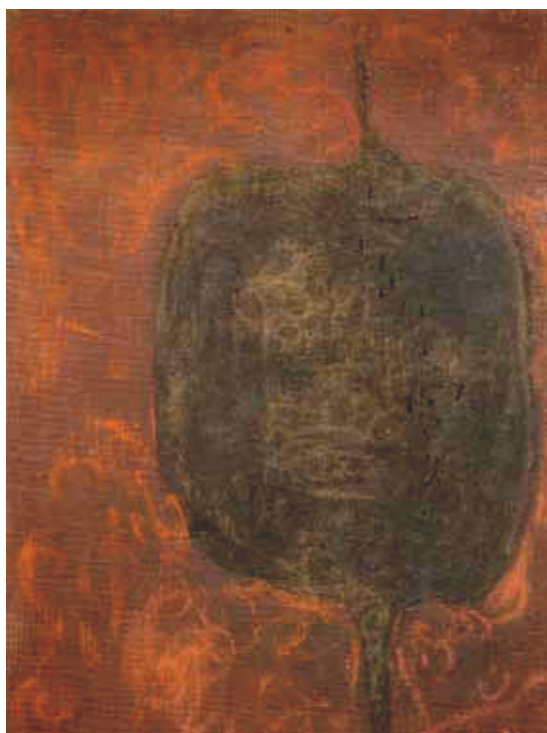
3279 Lucio Fontana "Concetto Spaziale." 1958 Huile sur toile. 167x120 cm

La série des ventes d'art moderne et contemporain de Koller du 19 juin a réalisé au total CHF 6.2 millions / EUR 4.15 millions.