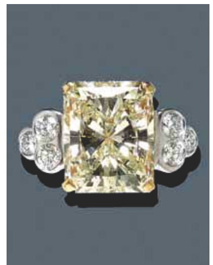
2162 Bague en diamant Environ 16 carats, Fancy Light Yellow / VS2 Avec 6 diamants taillés en brillant d'un total d'environ 1.4 carats, monté sur or blanc.