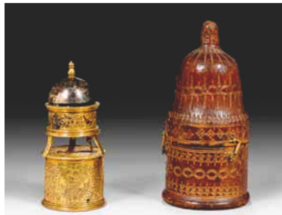
1006 Pendule de voyage avec réveil et son étui en cuir, Renaissance, Augsbourg, 16e siècle.