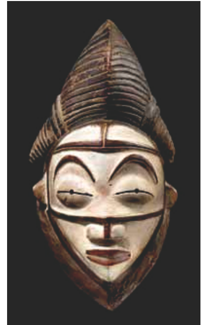
203 Masque Punu Gabon, H 31 cm.

Karl Green media@kollerauctions.com +41 22 311 03 85 +41 79 247 58 48 (mobile)