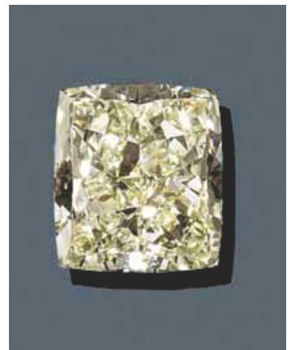
2071 Diamant non monté 20.15 carats, Fancy Light Yellow / VVS2.