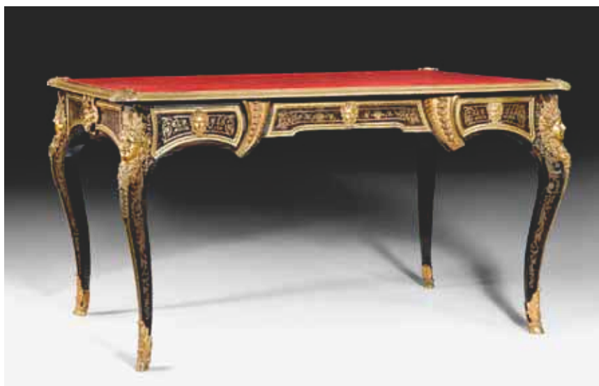
1318 Bureau plat à marqueterie Boulle, de style Régence, estampillé Gérard, France, 19e siècle.