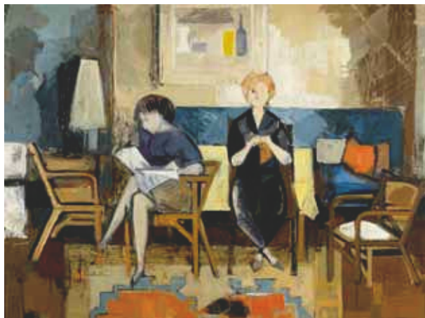
3284 Gerhard Richter Intérieur. 1960. Huile sur masonite. 74x100 cm.