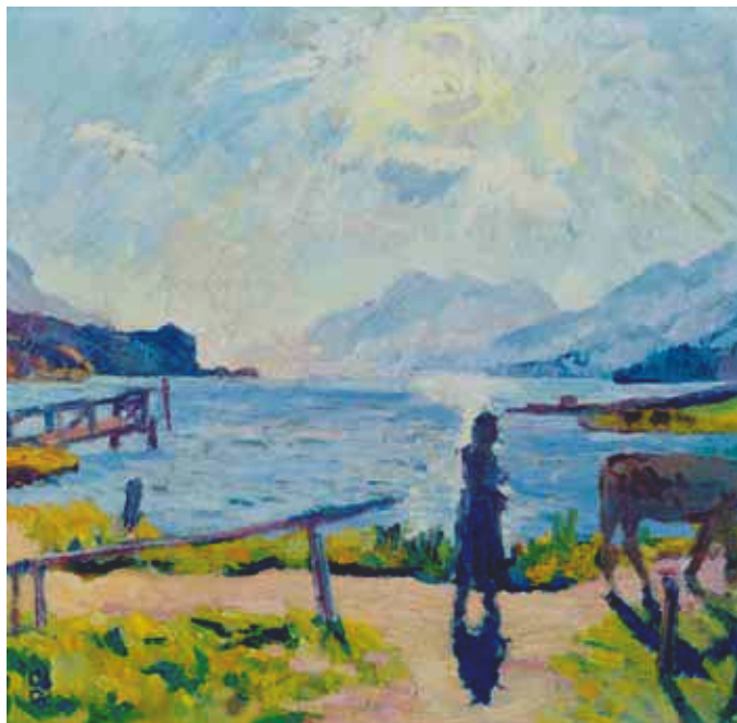
3057 Giovanni Giacometti Soleil du matin sur le Silsersee. 1924. Huile sur toile. 35.5 x 37 cm.