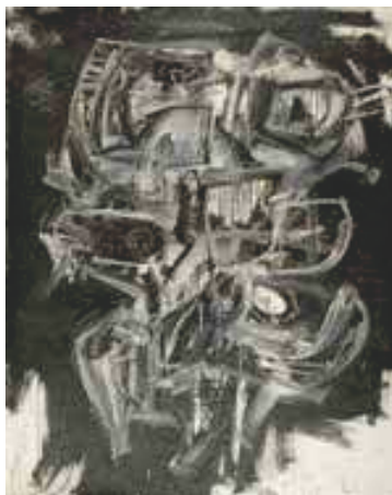
3268 Antonio Saura "La niña de los peines". 1956 Huile sur toile. 162x130 cm.