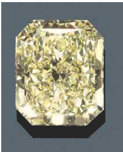
2186 Diamant non monté 37.52 carats, Fancy Yellow / VVS2.

Le total de la vente de joaillerie se monte à CHF 1.84 million / EUR 1.21 million.