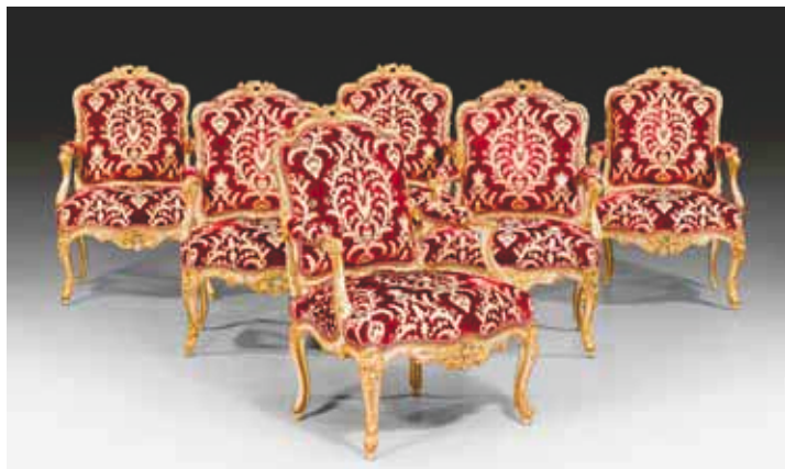
1080A Suite de 6 fauteuils peints, Louis XV, vraisemblablement Würzburg vers 1740/50.