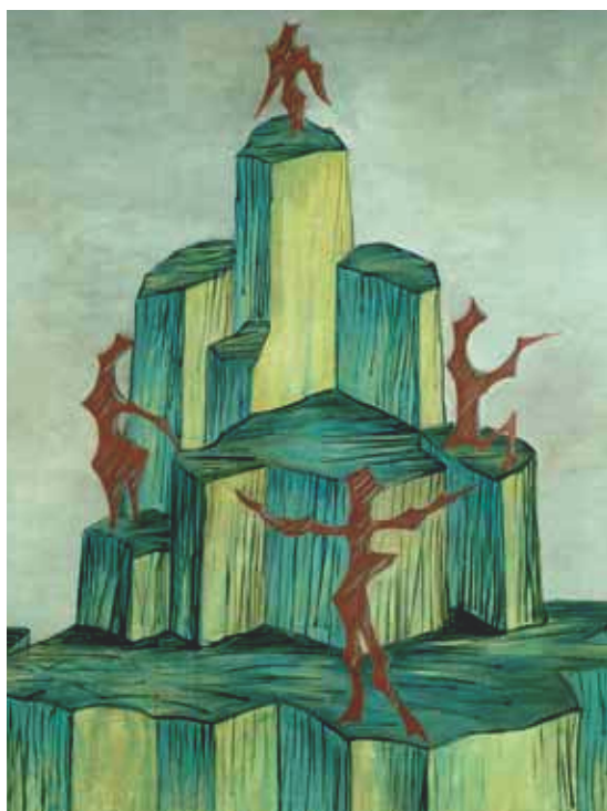
3274 Man Ray "La Montagne de Cristal." 1950. Huile sur toile. 80x60 cm.