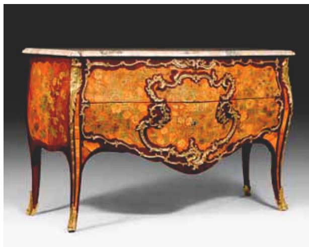
1092 Magnifique commode "à fleurs", Louis XV, estampillée P. Roussel, Paris, 18e siècle.

Au total, la vente de mobilier de prestige de Koller a réalisé CHF 4.5 millions / EUR 3.01 millions.