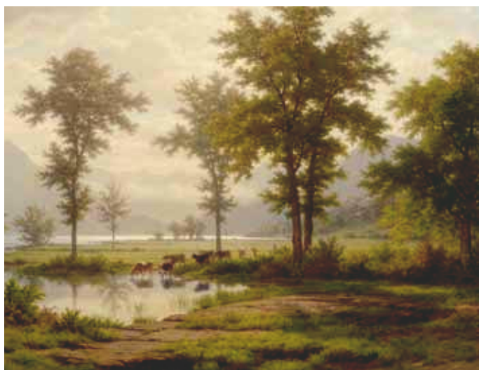
3014 Robert Zünd Vue sur le Lac des Quatre Cantons. Huile sur toile. 84x113 cm.