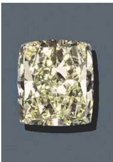
2071A Diamant non monté 20.91 carats, Fancy Light Yellow / VVS2.