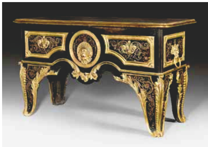
1083 Important "bureau en commode", Régence, par A.C. Boulle et fils, Paris, après 1723.