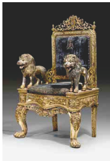
1342 Paire de fauteuils d'apparat, Rajasthan (Inde), 19e siècle.