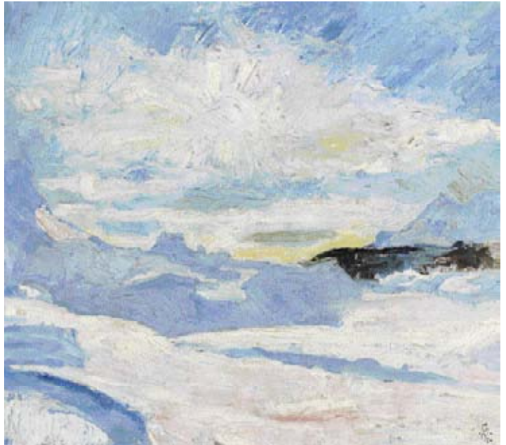
Z27 / 3043 GIOVANNI GIACOMETTI Paysage hivernal près de Maloja. 1925. Huile sur toile. 40x45 cm.

Pour une photo en haute résolution, veuillez cliquer sur l'image.