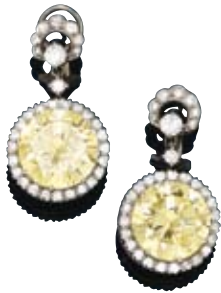
A151 / 2030 BOUCLES D'OREILLES ET PENDANT EN DIAMANT Clips en or blanc, chacun serti d'un brillant de près de 10.2 carats / 9.4 carats, environ U-V / VS1, et un pendant serti d'un brillant de près de 11.7 carats, environ U-V / VS1.