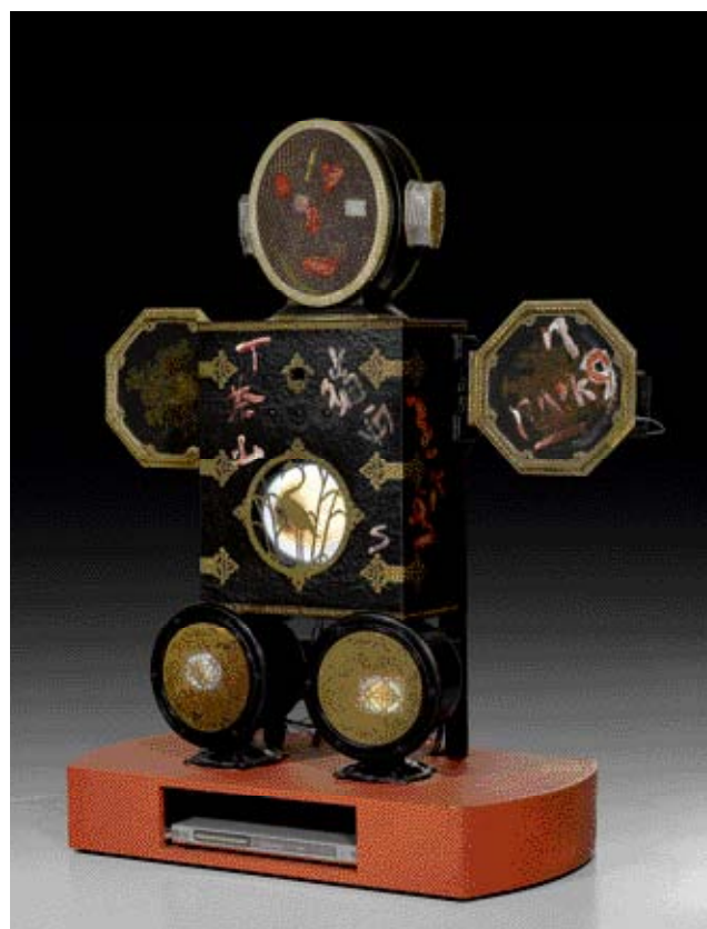
Z27 / 3467 NAM JUNE PAIK "Black Torero." H 146 cm.

Pour une photo en haute résolution, veuillez cliquer sur l'image.