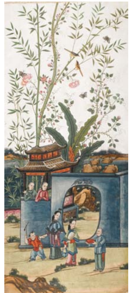
A151 / 1172 SUITE DE 7 "PAPIER PEINTS" Louis XVI, Chine vers 1800.