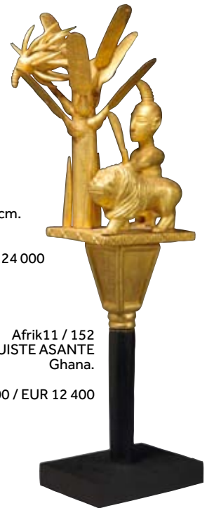
Afrik11 / 152 BATON DE LINGUISTE ASANTE Ghana.