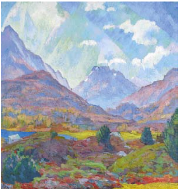
Z27/3058 GIOVANNI GIACOMETTI Monte Forno. 1921. Huile sur toile. 115.5x107.5 cm.

Pour une photo en haute résolution, veuillez cliquer sur l'image.