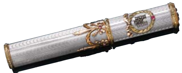
A151 / 2200 ETUI A CIRE DE L'EMPIRE DE RUSSIE EN OR ET EMAIL Avec monogramme du Tsar Nicolas II. et couronne avec diamants et rubis.