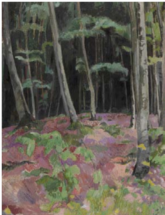
Z27 / 3057 CUNO AMIET Forêt. 1920. Huile sur toile. 86x66 cm.