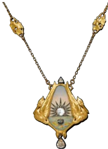
A151 / 2141 PENDANT / BROCHE EN DIAMANT ET EMAIL attribué à Antoine Bricteux, vers 1900. Vendu pour CHF 26 400 / EUR 18 200