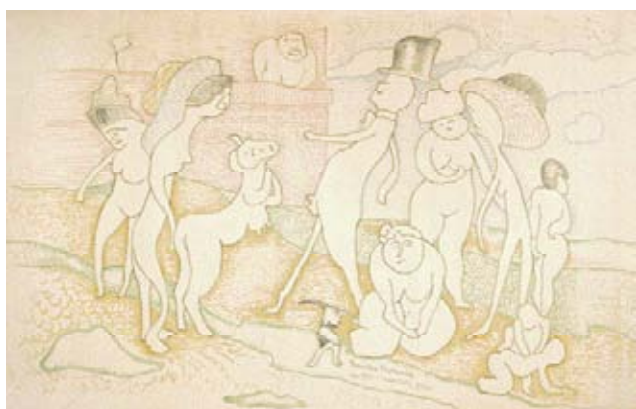
Z27 / 3505A MAN RAY "Première Promenade en 1912." 1958. Huile sur toile. 21.5x31.5 cm

Pour une photo en haute résolution, veuillez cliquer sur l'image.