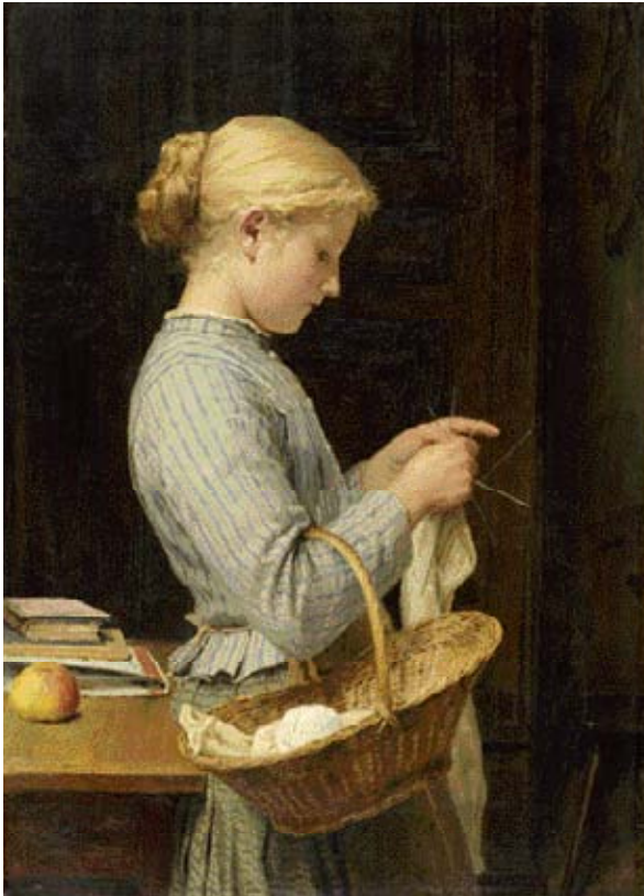
Z27 / 3019 ALBERT ANKER "Strickendes Mädchen." 1888. Huile sur toile. 63x45.5 cm.

Vendue pour CHF 3 010 000 / EUR 2 000 000