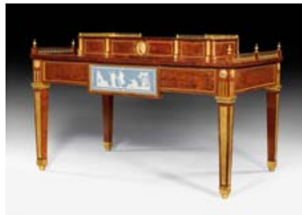
A151 / 1208 TABLE DE MILIEU "A LA ROENTGEN" DE L'EMPIRE DE RUSSIE Louis XVI, vers 1790/1800.