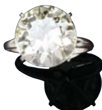
A151 / 2153 BAGUE EN DIAMANT Vers 1950, 12.53 ct, U / SI1.