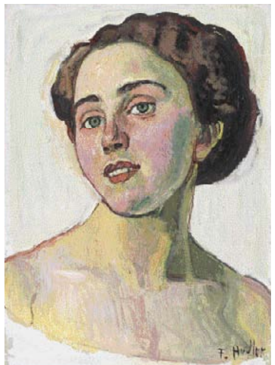
Z27 / 3041 FERDINAND HODLER Portrait d'une femme. Vers 1914. Huile sur toile. 40.2x29.8 cm.