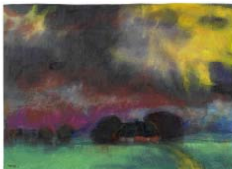
Z27 / 3259 EMIL NOLDE "Bauernhaus in der Marschlandschaft." Vers 1920/25. Aquarelle sur papier japon. 33x45 cm.

Pour une photo en haute résolution, veuillez cliquer sur l'image.