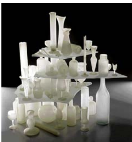
Z27 / 3487 TONY CRAGG "Silicate Landscape." 1992.