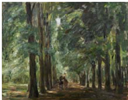
Z27 / 3226 MAX LIEBERMANN "Zwei Reiter in der Allee bei Sakrow." 1924. Huile sur toile. 95.7x114.8 cm.