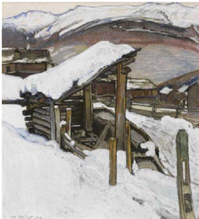
Z27 / 3046 EDOUARD VALLET Vue d'un village valaisan en hiver. 1912. Pastel, aquarelle et mine de plomb sur papier. 51x46 cm.