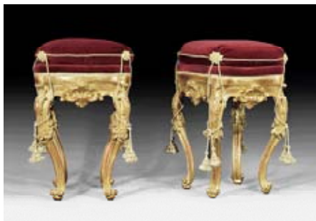
A151 / 1025 SUITE DE 4 TABOURETS Louis XV, Sicile vers 1760.

Parmi d'autres objets rares de la vente, il faut noter une série de quatre tabourets dorés Louis XV de Sicile (lot 1025) qui ont atteint CHF 70 800 / EUR 48 800, une pair de cabinets en laque Louis XVI tardif (lot 1165), ou une série de sept "papiers peints" Louis XVI (lot 1172) faite en Chine pour le marché européen. Une table de milieu Louis XVI "à la Roentgen" de l'Empire de Russie (lot 1208), appelée ainsi puisqu'elle venait imiter le style et la qualité exceptionnelle de l'ébéniste allemand David Roentgen, s'est vendue pour CHF 96 000 / EUR 66 200. Parmi les pièces de mobilier du 19e siècle, il faut citer une spectaculaire table de milieu Napoléon III à marqueterie, estampillée par le Florentin Giuseppe Grandi (lot 1355) qui a changé de mains pour CHF 54 000 / EUR 37 200.