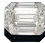
A151 / 2118 DIAMANT NON MONTE 21.70 ct. I / VS1.