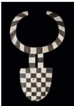
AFRIKA12 / 1651 MASQUE NAFANA Burkina Faso. H 204 cm.

Un gong Mangbetu (lot 1721) vendu pour CHF 22 800 / CHF 16 600 a lui aussi créé la surprise. Ces gongs servaient parfois de présents de rois aux princes. Indispensable pour marquer l'arrivée du roi ou sa prise de parole, ils jouaient également un rôle dans les cérémonies et aidaient les prêtres à entrer en communication avec les esprits.