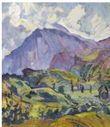
Z28 / 3034 GIOVANNI GIACOMETTI (Stampa 1868-1933 Glion) Moisson près de Maloja. 1923. Huile sur toile. 101x93 cm.