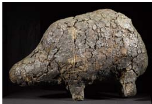
AFRIKA12 / 1609 BAMANA ALTAR, Mali. H 32 cm.