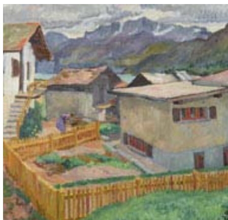
Z28 / 3037 GIOVANNI GIACOMETTI (Stampa 1868-1933 Glion) A Capolago, Vue sur Corvatsch. Vers 1926. Huile sur toile. 50x55 cm.