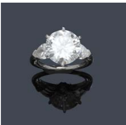
A153 / 2019 BAGUE EN DIAMANT, vers 1950.