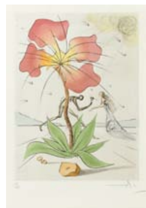
Z28 / 3631 SALVADOR DALÍ (1904 Figueres 1989) The twelve tribes of Israel.