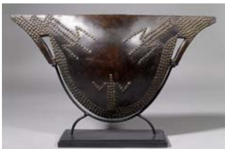
AFRIKA12 / 1721 GONG MANGBETU Kongo. H 37 cm.