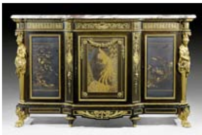
A153 / 1332 LACKANRICHTE „AUX CARIATIDES“, de style Louis XVI, estampillée GROHE A PARIS, Paris vers 1855/65.

Mais bien plus parlant encore, les résultats de pièces de mobilier et pendules plus courantes laissent surprendre comme CHF 9 600 / EUR 7 000 pour une paire de fauteuils attribués à Jean-Baptiste II Tiliard (lot 1015); CHF 15 000 / EUR 10 900 pour une paire de bureaux victoriens (lot 1051); CHF 31 200 / EUR 22 700 pour une ensemble de douze chaises vénitiennes peintes (lot 1116), ou CHF 27 600 / EUR 20 100 pour une petit bureau en marqueterie Louis XV (lot 1185). De tels résultats laissent présager que le marché moyen du mobilier – un sujet certes peu discuté par la presse – montre des signes de convalescence. C'est peut-être la conclusion économique la plus significative à tirer de cette série d'enchères et un phénomène à suivre de près dans les ventes à venir.