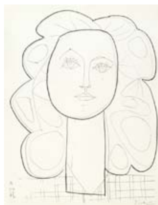
Z28 / 3697 PABLO PICASSO (1881-1973) Françoise. 1946. 65x49,8 cm.