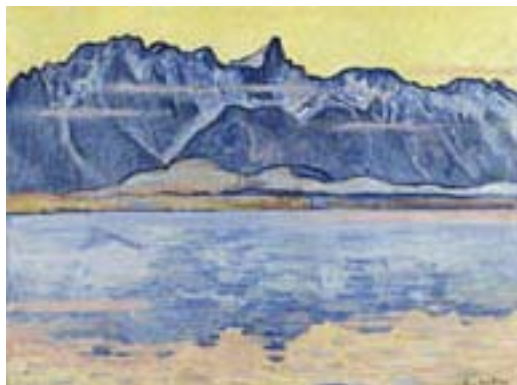
Z28 / 3029 FERDINAND HODLER (Bern 1853-1918 Genf) Lac de Thoune et la chaîne du Stockhorn. Vers 1913. Huile sur toile. 62,5x85,5 cm.

Vendu pour CHF 2 320 000 / EUR 1 690 000