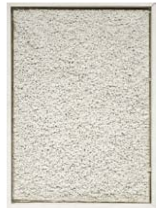
Z28 / 3482 PIERO MANZONI (Cremona 1933-1963 Mailand) Achrome. 1962. Billes de polystyrène et kaolin sur toile. 70x50 cm.