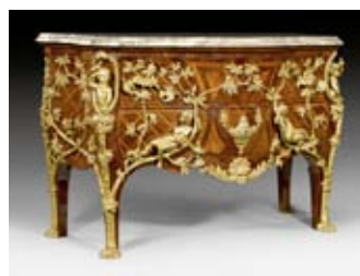
A153 / 1307 COMMODE, de style Régence, attri- buée à F. LINKE, Paris vers 1900.