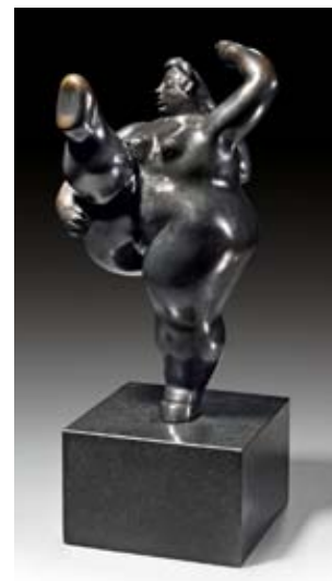
Z28 / 3436 FERNANDO BOTERO (1932 Medellin, vit et travaille à Paris et New York) Ballerine. 1981. Bronze à patine brun-noir. H 32 cm.