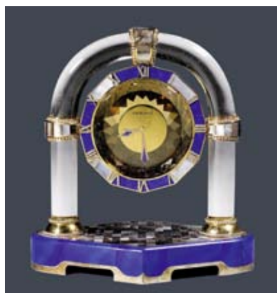
A153 / 2190 „PENDULE MYSTERIEUSE“ EN CRISTAL, LAPIS-LAZULI, NACRE ET DIAMANT, Chaumet, 1985.