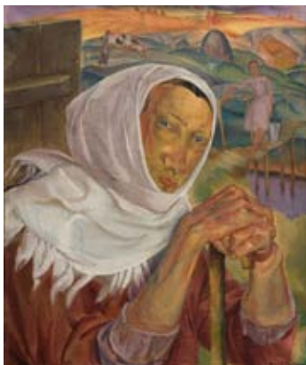
Z28 / 3226 BORIS GRIGORIEV (Rybinsk 1886-1939 Cagnes-sur-Mer) Portrait d'une paysanne russe. Vers 1920. Huile sur toile. 54,4x46 cm.

La vente aux enchères d'art contemporain avait l'avantage de présenter l'"Acrome" par Piero Manzoni (lot 3482), avec son effet monochrome obtenu par l'emploi de matériau peu courants: des billes de polystyrène et kaolin sur toile. Cette œuvre de l'"Arte Povera" a atteint CHF 228 000 / EUR 166 400. Une œuvre plutôt atypique de Botero intitulée "Ballerine" (lot 3436) a lui culminé à CHF 144 000 / 105 000.