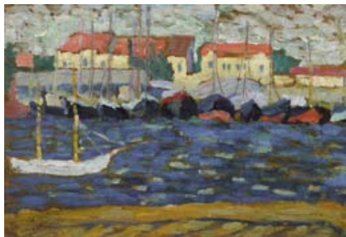
Z28 / 3215 DAVID DAVIDOVICH BURLIUK (Semyrotivka 1882-1967 New York) Le port. 1906. Huile sur panneau. 20x31,7 cm.