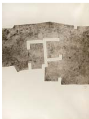
Z28 / 3624 EDUARDO CHILLIDA (1924 San Sebastian 2002) Euzkadi V. 1976. 160x120,5 cm.