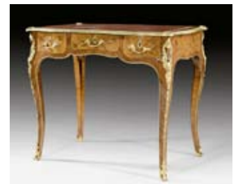
A153 / 1185 PETIT BUREAU-PLAT „A FLEURS“, Louis XV, à la manière de H. HAN- SEN, Paris vers 1755.