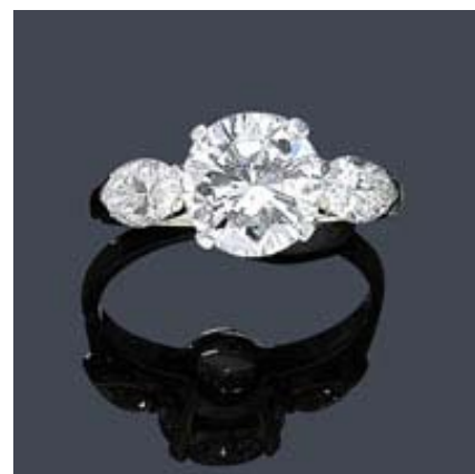
A153 / 2134 BAGUE EN DIAMANT, Gübelin, vers 1950.