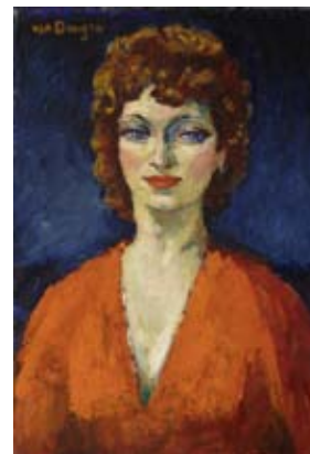
Z28 / 3231 KEES VAN DONGEN (Delfshaven 1877-1968 Monaco) Portrait d'une femme. Huile sur toile. 55,1x38,1 cm.