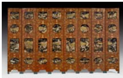
A153 / 1056 PARAVENT A HUIT VOLETS, Kangxi, Chine.