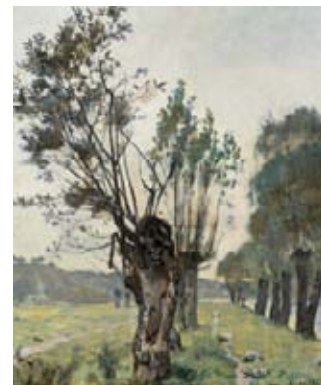
Z28 / 3023 FERDINAND HODLER (Bern 1853-1918 Genf) Champs près de la Jonction. Atmosphère du soir. 1878. Huile sur toile. 55x46 cm.