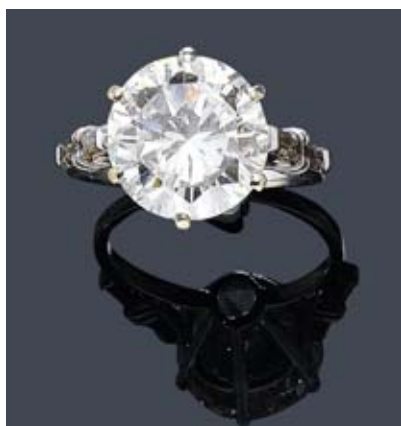
A153 / 2124 BAGUE EN DIAMANT, France, vers 1950.

Au total, la vente de joaillerie a comptabilisé CHF 1.55 million / EUR 1.13 avec une estimation globale du catalogue à CHF 1.27 million / EUR 930 000.