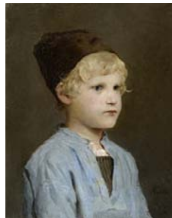
Z28 / 3007 ALBERT ANKER (1831 Ins 1910) Portrait d'un garçon au bonnet. Huile sur toile. 42,5x34 cm.

Au total, la vente aux enchères d'art suisse de Koller a comptabilisé CHF 8.2 millions / EUR 6 millions pour une estimation globale du catalogue à CHF 7 millions / EUR 5.1 millions.