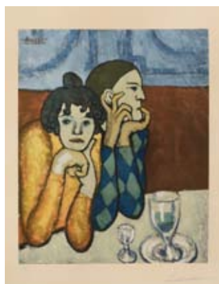
Z28 / 3700 PABLO PICASSO (1881-1973) "Les artistes". 94,5x71 cm.