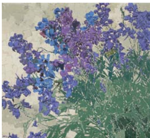
Z28 / 3036A AUGUSTO GIACOMETTI (1877-1933) Pieds-d'alouette. 1911. Huile sur toile. 62,5x85,5 cm.