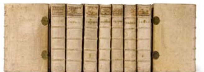
A153 / 239 MATHÄUS MERIAN Topographia Germaniae . Suite complète. 1703.