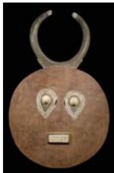
AFRIKA12 / 1632 MASQUE BAULE Côte d'Ivoire. H 102 cm.