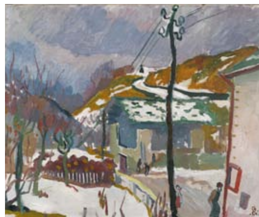
Z28 / 3047 GIOVANNI GIACOMETTI (Stampa 1868-1933 Glion) Strada, sciogliere della neve (Fonte des neiges). Vers 1915. Huile sur toile. 38x46,5 cm.