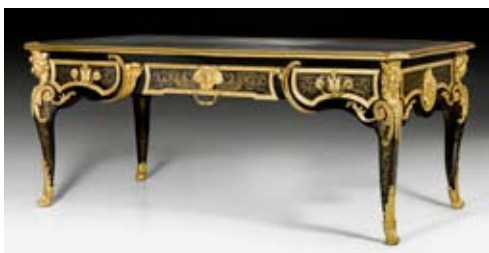
A153 / 1308 BUREAU-PLAT AVEC MARQUETERIE BOULLE, de style Régence, estampillé BEFORT JEUNE, Paris vers 1860.