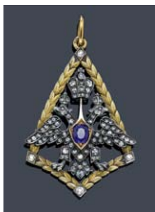
A153 / 2083 PENDENTIF AVEC SAPHIR ET DIAMANTS, E. Kollin, St. Petersburg vers 1900.