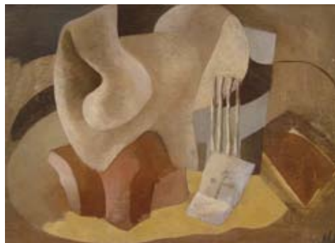
Z28 / 3210A MARDSEN HARTLEY (Lewiston 1877-1943 Ellsworth) Nature morte. 1923. Huile sur toile marouflée sur carton. 30,5x40,6 cm.