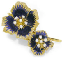
Lot Nr. 2025: EMAIL-DIAMANT-GOLD-CLIPBROSCHÉ, CARTIER, um 1945.

CHF 10 000.- / 15 000.- (€ 7 700.- / 11 600.-)