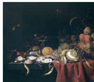
Lot Nr. 3035: JAN JANSZ DE HEEM (Antwerpen 1650 - circa 1695 London) Stilleben mit Früchten und Austern auf einem Tisch. Öl auf Leinwand. 60,5x69,5 cm.

CHF 120 000.- / 180 000.- (€ 93 000.- / 140 000.-)