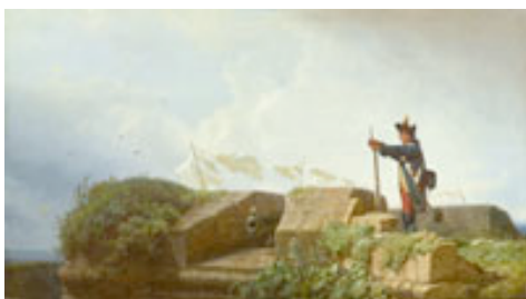
Lot Nr. 3207: CARL SPITZWEG (Unterpfaffenhofen 1808 - 1885 München) Friede im Land (Auf der Bastei). Öl auf Leinwand. Signiert und datiert von 1856. 22,8x40 cm.

«Der Friede im Land» von Carl Spitzweg gehört zu den Perlen der Auktion für Gemälde des 19. Jahrhunderts. Das allzu Menschliche in Spitzwegs Interpretation des Biedermeiers zeigt sich hier im gähnenden Soldaten auf seiner von Unkraut und Spatzen «eroberten» Bastei. Das typische Sujet aus dem Jahre 1856 wird mit einer Schätzung zwischen CHF 500 000 und 800 000 ausgerufen. Russische Kunst ist unter anderem mit Ivan Konstantinovic Aivazovsky vertreten. Beim hier angebotenen Werk aus dem Jahre 1878 gewährt uns der Künstler einen einnehmenden Blick auf den von grossen Segelschiffen befahrenen Bosphorus bei Abenddämmerung (CHF 350 000 bis 450 000).