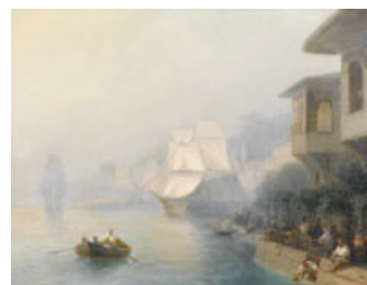
Lot Nr. 3222: IVAN KONSTANTINOVICH AIVAZOVSKY (1817 Feodosija 1900) Blick auf den Bosphorus. 1878. Öl auf Leinwand. Unten rechts signiert und datiert: Aivazovsky 1878. 68x88,5 cm.

CHF 500 000.- / 800 000.- (€ 386 000.- / 618 000.-)