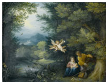
Lot Nr. 3039: JAN BRUEGHEL d. J. (1601 Antwerpen 1678) Ruhe auf der Flucht nach Ägypten. Öl auf Kupfer. 23,5x30 cm.

CHF 350 000.- / 500 000.- (€ 270 000.- / 386 000.-)