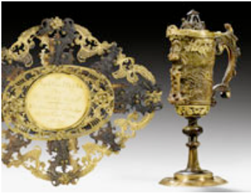
Lot Nr. 1517: PRUNKKANNE MIT PRÉSENTOIR AUS STEINBOCKHORN MIT VERGOLDETER KUPFERMONTIERUNG, SALZBURG, SIG-NIERT M.L.GIZL, DATIERT 1758.

CHF 50 000.- / 90 000.- (€ 38 000.- / 69 000.-)