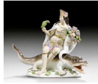
Lot Nr. 1593: GROSSE ALLEGORISCHE GRUPPE 'AMERIKA' AUS DER SERIE DER VIER ERDTEILE, MEISSEN, UM 1745.

CHF 12 000.- / 18 000.- (€ 9 200.- / 14 000.-)