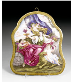
Lot Nr. 1518: VIER SELTENE EMAIL PLAKETTEN 'DIE VIER JAHRESZEITEN', AUGS-BURG, UM 1710. Emailmalerei auf Kupfer. D 20 CM.

CHF 50 000.- / 90 000.- (€ 38 000.- / 69 000.-)