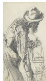
Lot Nr. 3504: Adolph von Menzel (Breslau 1815-1905 Berlin) Mann mit einem Vogelkäfig, 1883. Zimmermannsbleistift. 21,3x12,2 cm.

CHF 5 000.- / 7 000.- (€ 3 860.- / 5 400.-)