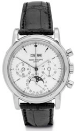
Lot Nr. 2390: HERRENARMBANDUHR, CHRONOGRAPH MIT EWIGEM KALENDER, PATEK PHILIPPE, Ref. 3970.

CHF 25 000.- / 35 000.- (€ 19 500.- / 27 000.-)