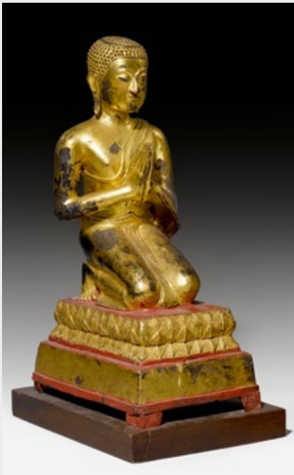
1175 (1 von 2)