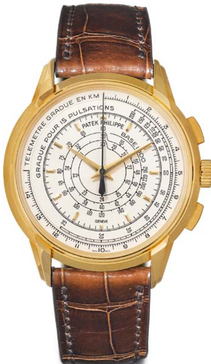
Jubilé Chronographe Patek Philippe, 2015. or jaune 750.