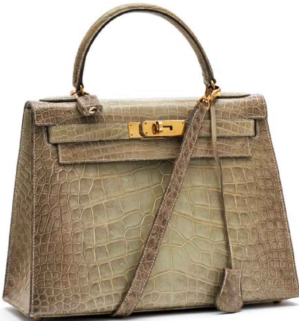
HERMÈS PARIS Sac Kelly Sellier 28 cm. 1995.