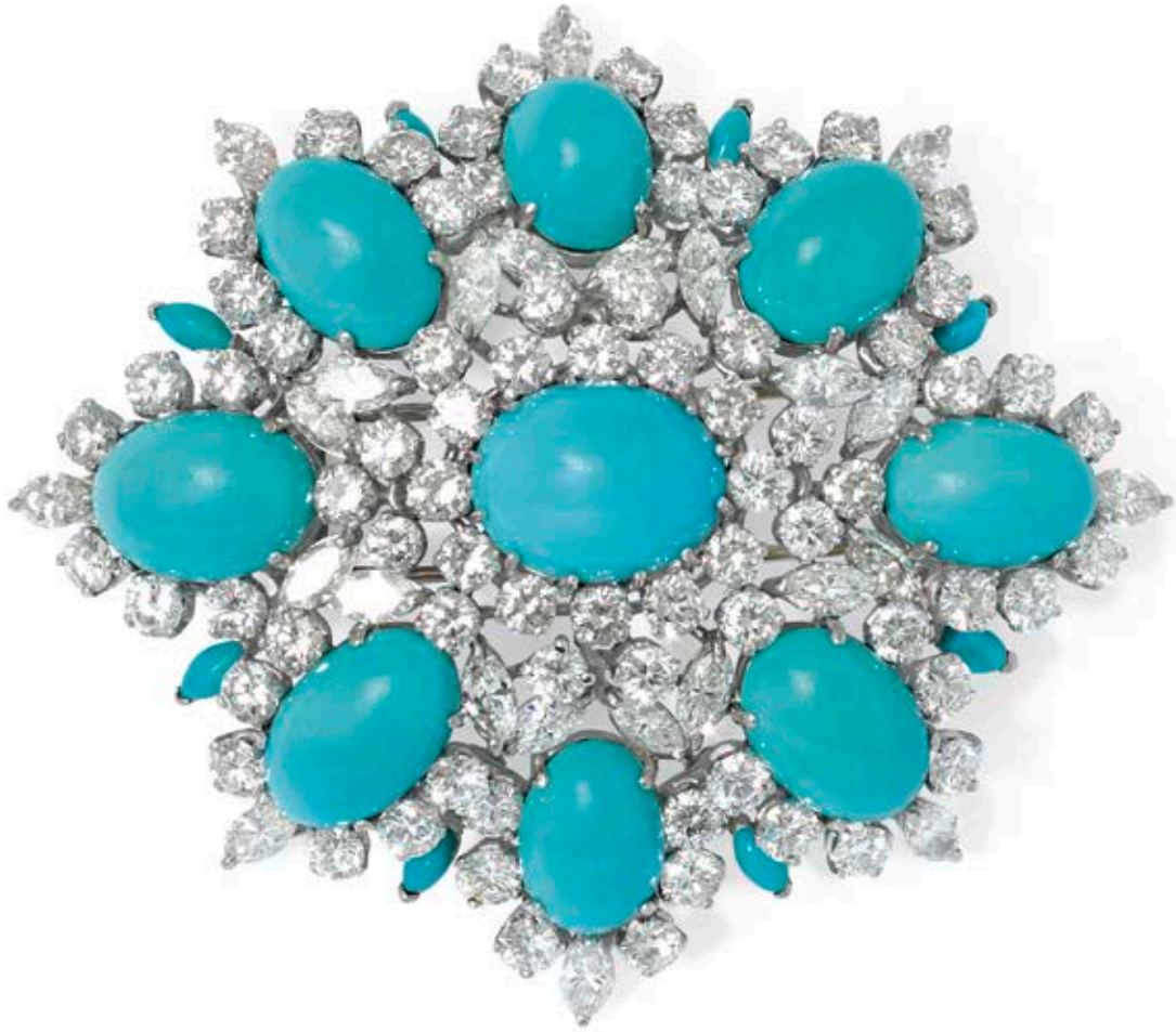
Broche turquoises et diamants avec clips d'oreilles, vers 1960.