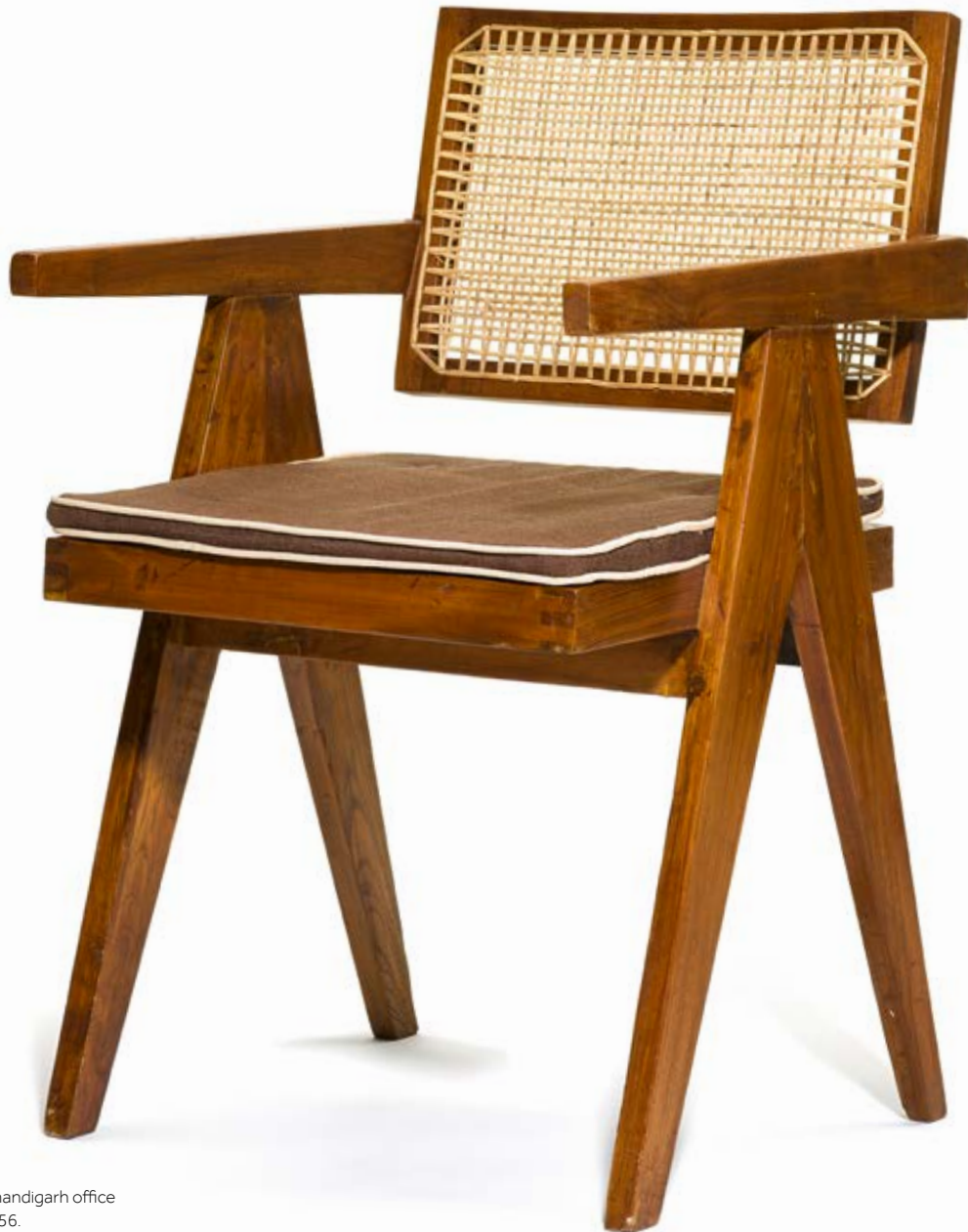
PIERRE JEANNERET, DIT „LE CORBUSIER“ (1896 - 1967) FAUTEUIL, modèle „Chandigarh office chair“, design 1955-1956. Estimation : CHF 5 000 – 7 000