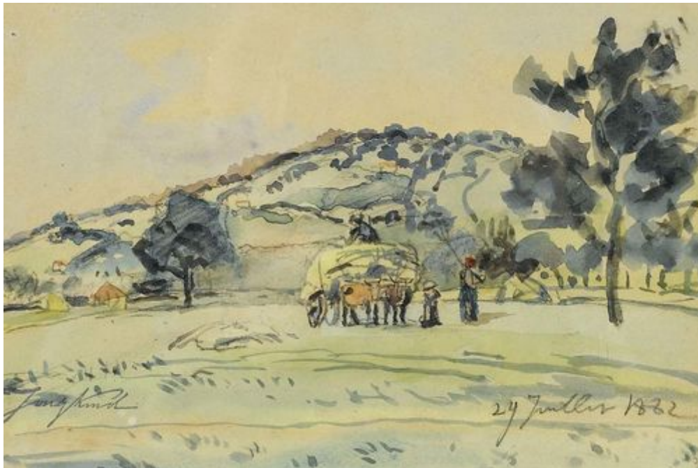
JOHAN BARTHOLD JONGKIND

A160 19世纪的绘画作品 - Freitag 30 März 2012, 04.30 PM