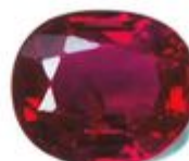
Not to scale / Pas à l'échelle