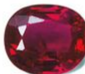
Not to scale / Pas à l'échelle