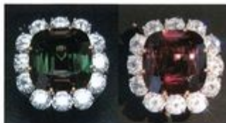
Not to scale / Pas à l'échelle

REPORT OF GEMMOLOGICAL EXAMINATION No. 3811/12 RAPPORT D'EXAMEN GEMMOLOGIQUE