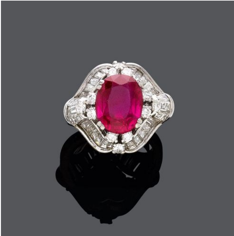
BURMA RUBY AND DIAMOND RING, BY E. MEISTER.