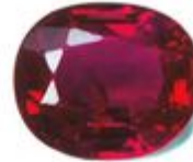
Not to scale / Pas à l'échelle