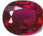
Not to scale / Pas à l'échelle