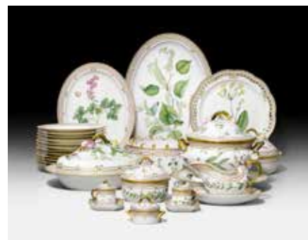
FLORA DANICA. Service à plus de 150 pièces, Royal Copenhagen.

EN BAS A DROITE : KONRAD PEUTINGER. Traité autographe sur la relation entre la royauté et la papauté. Elaboré avant 1519. CHF 60 000 – 80 000.