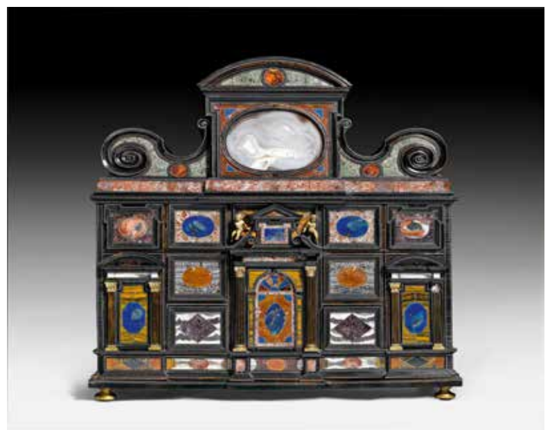
CABINET AU "PIETRA PAESINA", Renaissance, Florence, 17e siècle. CHF 100 000 - 200 000.