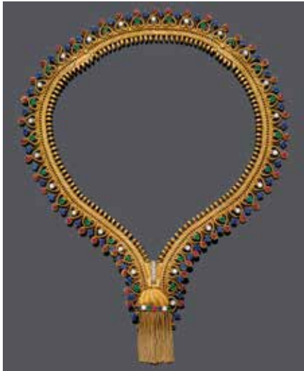
COLLIER/BRACELET PIERRES PRECIEUSES ET DIAMANTS, VAN CLEEF & ARPELS, vers 1950. Modèle "Zip". Poids total des 55 rubis et 52 saphires env. 9.90 ct, des 29 émeraudes env. 1.40 ct et des 19 brillants env. 1.50 ct. CHF 130 000 - 200 000.