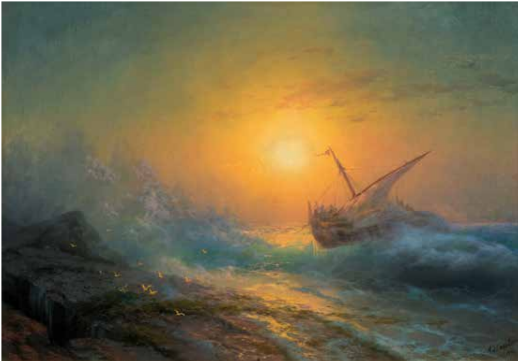
IVAN KONSTANTINOVICH AIVAZOVSKY (1817 Théodosie 1900). Mer houleuse au coucher de soleil. 1896. Huile sur toile. 68 x 99 cm. CHF 380 000 – 550 000

Zurich – Les ventes de printemps chez Koller présentent une sélection impressionnante de mobilier et de pendules provenant de plusieurs collections particulières suisses, dont un bureau à gradin Louis XVI qui faisait partie autrefois de la collection royale du Nouveau Palais à Stuttgart. A temps pour le 200e anniversaire de la naissance du peintre russe Ivan Aivazovsky, Koller offre une grande peinture marine de l'artiste, récemment redécouverte dans une collection particulière. La vente de Maîtres anciens présente une nature morte de grand format par le maître hollandais Balthasar van der Ast. D'autres points forts de la vente sont un grand service en porcelaine « Flora Danica », et un manuscrit de musique rarissime de Felix Mendelssohn.