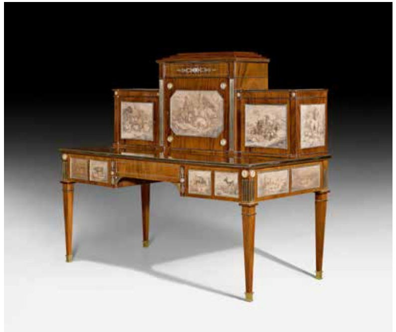
BUREAU A GRADIN ROYAL. Louis XVI, J. KLINCKERFUSS, vers 1800. Anciennement dans la collection du Nouveau Palais, Stuttgart. CHF 120 000 – 200 000.

D'autres pièces de mobilier exceptionnelles passeront dans cette vente, telles qu'une importante pendule de cheminée Directoire «à l'Indien et l'Indienne enlacés», illustrant le thème du «bon sauvage» si prisé par l'aristocratie française à l'aube du 19ème siècle (lot 1241, CHF 250 000 – 350 000); un superbe cabinet en «pietra paesina» datant de la Renaissance florentine (lot 1024, CHF 100 000 – 200 000), et une paire d'encoignures (armoires d'angle) à la manière de Boulle en marqueterie Louis XV, estampillées Joseph