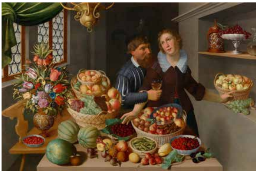
GEORG FLEGEL et probablement MARTEN VAN VALKENBORCH. Grande nature morte. Vers 1610-15. Huile sur toile. 114,5 x 173 cm. CHF 300 000 – 500 000.

Une autre nature morte, digne d'intérêt, dans la vente aux enchères de tableaux anciens est un tableau captivant de Georg Flegel et plus probablement de Marten van Valkenborch (lot 3056, CHF 300 000 – 500 000). Il représente un homme tenant un verre de vin et s'approchant très près d'une jeune femme debout devant une table et des étagères chargées de fruits et de fleurs. Le tableau est riche de symboles, notamment dans le geste de la jeune femme qui pointe de la main gauche vers une grappe de raisin intacte – symbole de la chasteté et de la virginité – tandis que sa main droite désigne une assiette de mûres symbolisant le Jugement Dernier – une admonition de mener bonne vie et mœurs. Flegel fut l'un des