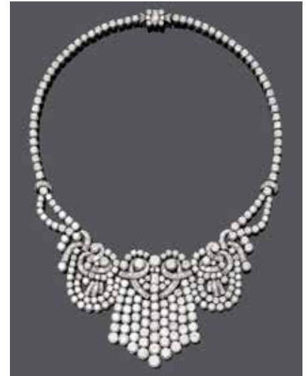
COLLIER DIAMANTS vers 1950. Serti de 92 diamants de taille baguette d'un total d'environ 18.00 ct, et 241 brillants d'un total d'environ 73.00 ct. CHF 130 000 - 200 000.