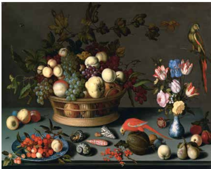
BALTHASAR VAN DER AST. Grande nature morte aux fruits et fleurs. Vers 1620. Huile sur panneau. 77 x 107 cm. CHF 850 000 – 1,2 millions.

La vente aux enchères de tableaux de Maîtres anciens qui aura lieu le 31 mars présentera une nature morte de Balthasar van der Ast, exceptionnelle non seulement par ses dimensions, mais également par l'extrême qualité de la représentation des fleurs, fruits et insectes qui la composent (lot 3040, CHF 850 000 – 1 200 000). Cette œuvre, qui date d'environ 1620, est représentative de la période d'Utrecht du maître flamand ; c'est à cette époque que l'art de la nature morte entra dans sa phase la plus passionnante et que le style propre de van der Ast divergea de celui de son maître, Ambrosius Bosschaert le Vieux (1573-1621).