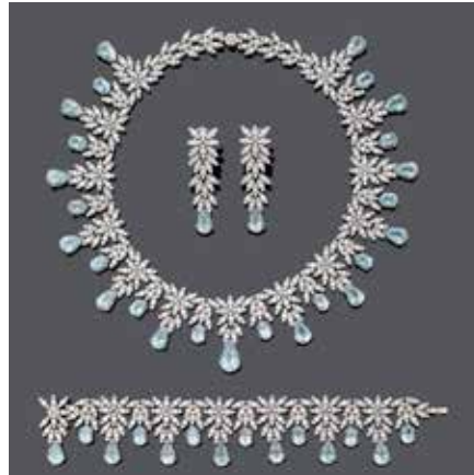
PARURE AQUAMARINES ET DIAMANTS Pasquale Bruni. Collection "Ghirlanda", réf. 12542B. Comprenant un collier, un bracelet et une paire de boucles d'oreilles. CHF 120 000 - 180 000.