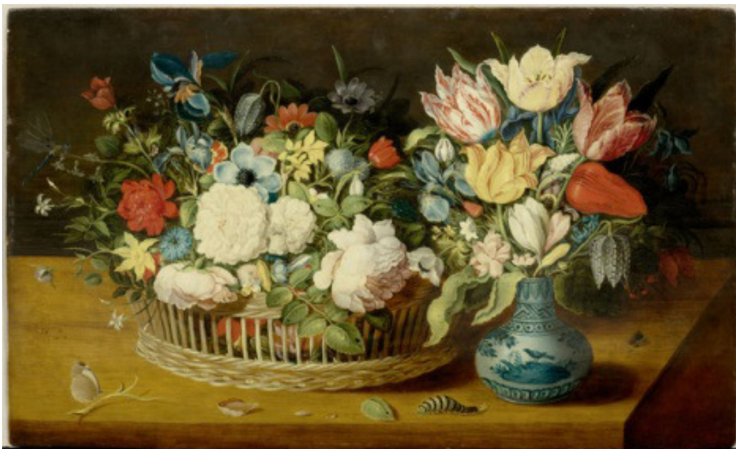
Osias Beert (lot 3031)