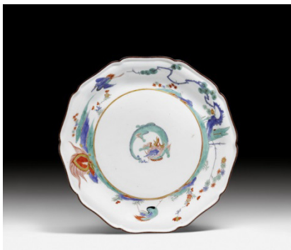
Assiette Meissen « Flaming Tortoise » (1737)

néoclassiques provenant de plusieurs importantes collections privées italiennes comporte deux superbes fauteuils Louis XVI, directement inspirés des dessins du créateur parisien J.-C. Delafosse (lot 1199, est. CHF 80 000 – 140 000). Un bureau en marqueterie Louis XV particulièrement raffiné de J.-P. Latz (lot 1107, est. 150 000 – 200 000) est l'un des plus beaux exemples mis aux enchères ces dernières années. Parmi les pièces du XIX e siècle, deux grands vases avec montures en bronze doré, provenant de la demeure de Suzanne Saperstein à Beverly Hills, seront proposés pour une valeur estimée de CHF 30 000 – 50 000 (lot 1279).