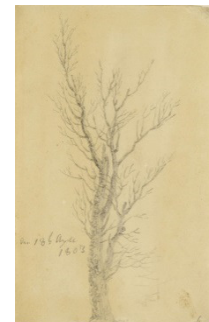
Caspar David Friedrich (lot 3457)