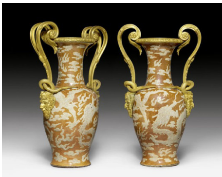
Collection Saperstein (1279)