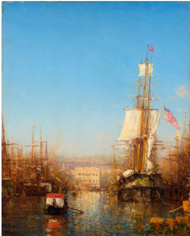
Félix François Ziem (lot 3205)

époque où les petits tableaux destinés aux dévotions privées étaient populaires, l'œuvre dépeint une scène de maternité extrêmement touchante.