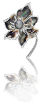
Broche Chaumet (lot 2032)