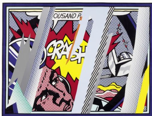
Roy Lichtenstein, vendu CHF 108 500

Le «Reflections on Crash» de Roy Lichtenstein a mené les enchères durant la vente d'estampes modernes et contemporaines avec une adjudication à CHF 108 500 (lot 3751). Parmi les lots phares, deux sérigraphies de Warhol, «Dollar Sign (1)» et «Paramount,» ont été vendues respectivement à CHF 42'500 et CHF 30'500 (lots 3277 et 3266). En outre, de nombreuses estampes d'artistes moins côtés tels que Victor Vasarely ou Sonia Delaunay ont obtenu d'excellents résultats en triplant souvent leurs estimations. Une collection de céramiques de Picasso, dont le marché connaissait des hauts et des bas, s'est également bien vendue.