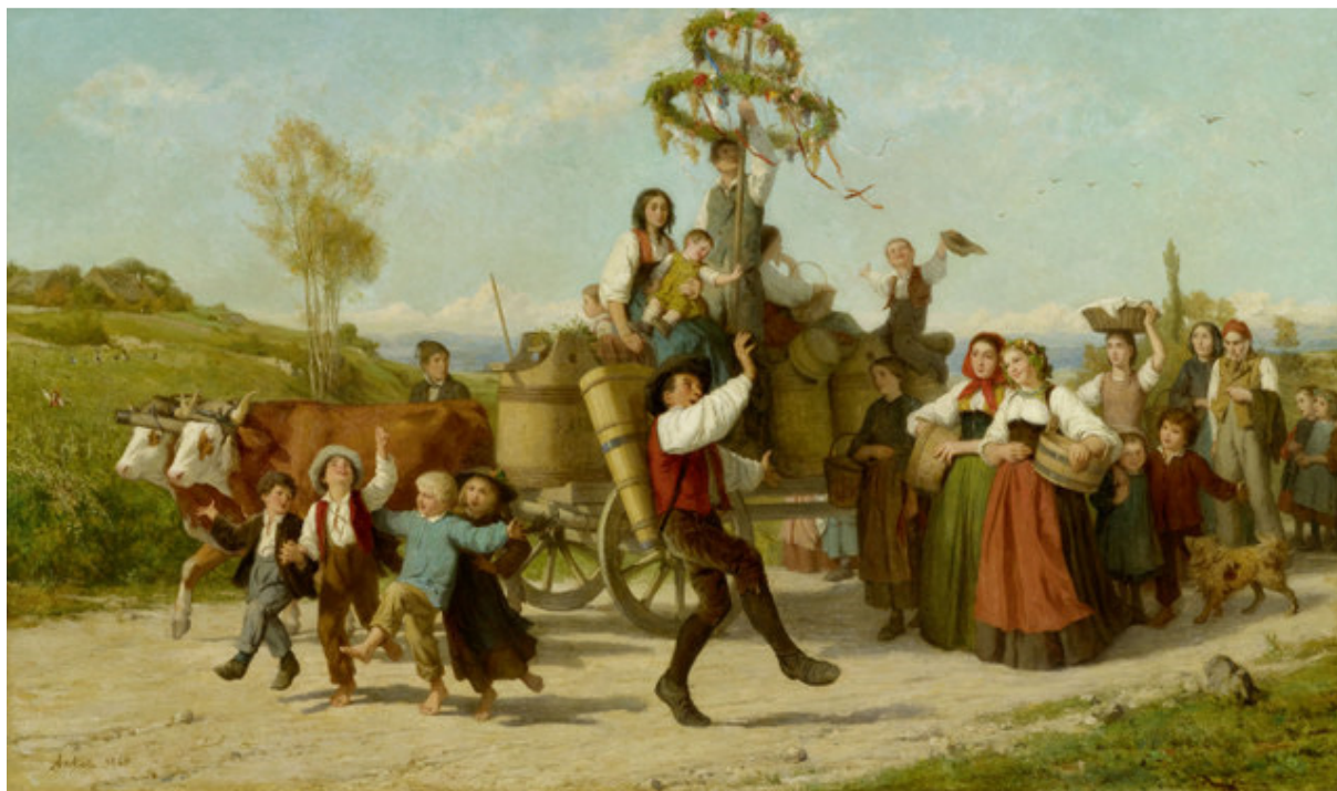
Albert Anker, vendu CHF 4.2 millions

Les ventes de peintures et estampes de la période PostWar & Contemporary, de l'art suisse ainsi que de l'horlogerie ont dépassé les 100% de leur valeur totale estimée.