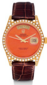
Rolex Day Date, vendue CHF 41 300

L'importante demande pour les montres vintage se perpétue chez Koller grâce à la seconde vente dédiée à ce secteur, animée d'enchérisseurs compétitifs pour des pièces allant des années '50 aux années '90. Le lot phare a été une Patek Philippe chronographe de 1994 vendue CHF 65 300 (lot 2551), suivie par la charmante Rolex Day Date de 1995 au cadran de couleur corail cerclé de diamants (lot 2587) et dont le prix d'adjudication de CHF 41'300 a littéralement écrasé son estimation de CHF 18'000. D'une élégance subtile, la Patek Philippe "Cuervo y Sobrinos" de 1955 a été adjugée à CHF 37 700 (lot 2554) alors que la classique et sportive Breguet Aviateur type XX chronographe des années '60 a largement dépassé son estimation CHF 9'000 pour atteindre CHF 24'500 (lot 2514). Plus de 90% des lots de cette vente ont trouvé preneurs dont une large majorité bien au delà de leurs estimations initiales.