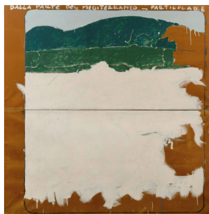
Mario Schifano, vendu CHF 180 500

Parmi les Highlights, il faut citer deux œuvres du début des années '60 réalisées par l'artiste Pop Mario Schifano dont le prix de vente a atteint CHF 180 500 et CHF 132 500 (lots 3427 et 3424), ainsi qu'une huile de Serge Poliakoff de 1965 vendue pour CHF 222 500 (lot 3431). Une série de compositions issues du Mouvement d'Art Concret zurichois a également suscité un vif intérêt tel que le « Groupe de huit carrés et quatre rectangles » adjugé à CHF 84'500 (lot 3415).