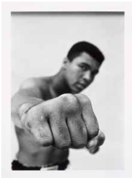
THOMAS HOEPKER. Muhammed Ali Showing Off His Right Fist. Archival Pigment Print, vers 2009. CHF 8 000 - 12 000.