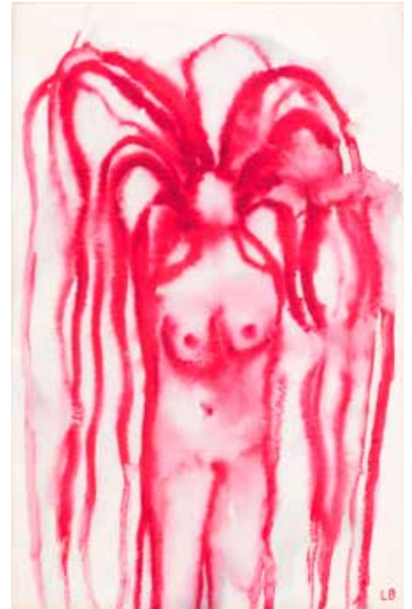
LOUISE BOURGEOIS. Girl with hair. Teintures Archival sur soie. 1/12. CHF 50 000 - 70 000.

Parmi les estampes de la vente, on découvre une œuvre exceptionnelle de Louise Bourgeois « Girl with Hair ». Créée entre 2007 et 2009 avec des teintures Archival sur soie, l'œuvre fait partie d'une édition restreinte de douze tirages (lot 3744, CHF 50'000 à 70'000). Andy Warhol est représenté par plusieurs œuvres dans cette vente, notamment par le célèbre « Flowers » de 1970 (lot 3733, CHF 18'000 à 24'000), tandis que l'artiste de Street Art Banksy est évoqué avec « Choose Your Weapon » dans lequel l'arme du titre est un pitbull tenu en laisse par une figure anonyme (lot 5041, CHF 12'000 à 18'000).