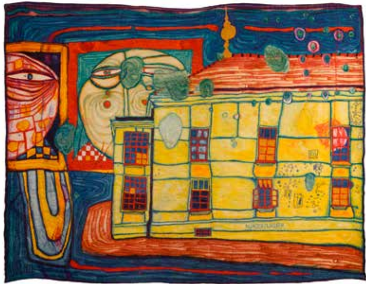
FRIEDENSREICH HUNDERTWASSER. „Franz Josef Spital“. 1981. Laine polychrome. CHF 20 000 - 30 000.