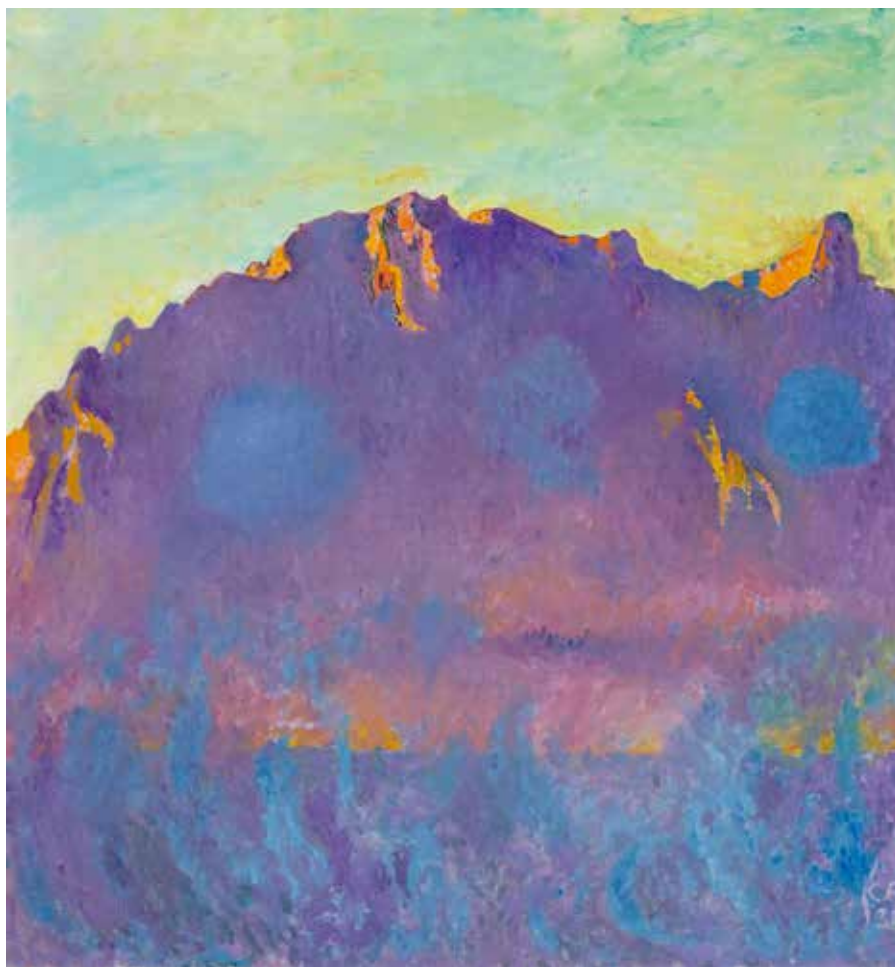
CUNO AMIET. View of the Stockhorn. Oil on canvas. CHF 350 000 - 450 000.

Parmi les œuvres des artistes suisses tels que Félix Vallotton, François Boccion, Augusto et Giovanni Giacometti dans cette vente, on trouve également le portrait frappant d'une femme valaisanne et de ses filles en habits traditionnels par Ernest Bieler, maître dans ce genre (lot 3077, CHF 250'000 à 350'000).