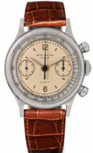
PATEK PHILIPPE. Chronographe avec cadran deux tons, 1961. Réf. 1463, acier. CHF 180 000 - 300 000.