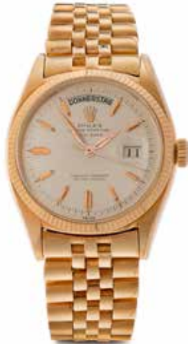
ROLEX. Vintage Day-Date, 1960. Réf. 6611 B, Or jaune 750. CHF 9 000 - 12 000.

Une Rolex Day Date vintage serait un ajout élégant à toute collection de montres. Celle-ci est estimée au prix modeste de CHF 9'000 à 12'000 (lot 2559).