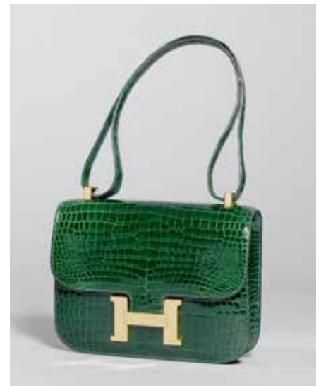
HERMES PARIS. Sac "Constance" en crocodile vert émeraude. CHF 13 000 - 15 000.

Avec des estimations allant de 80 à 18'000 CHF et plus de 300 lots, la vente sera l'occasion d'acquérir de la mode féminine et masculine, contemporaine et vintage des plus grandes marques (Hermès, Chanel, Louis Vuitton, Christian Dior, Yves Saint Laurent, Prada, Fendi, Lanvin, ...) pour tous les prix et tous les goûts.