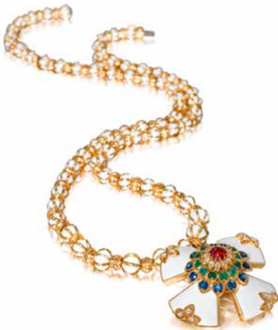
DAVID WEBB. Collier émail, pierres précieuses et diamants avec deux bracelets. CHF 50 000 - 70 000.