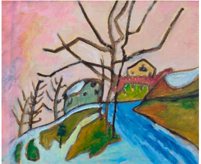
GABRIELE MÜNTER. Vereiste Strasse (Rue verglacée). 1911. Huile sur carton. CHF 200 000 - 300 000.

œuvres plus tardives, Münter a utilisé de scintillants plans de couleurs et des contours sombres pour définir le paysage, toutefois la composition ressemble à ces premières œuvres expressionnistes (lots 3225 et 3229, CHF 100'000 à 150'000 chacun).