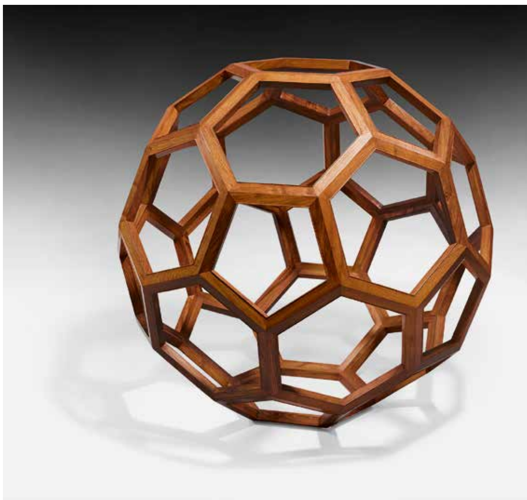
AI WEI WEI. Sans titre (Foster Divina). 2010. Bois de huanghuali. CHF 180 000 - 260 000.

Art Moderne & Contemporain – Art Suisse – Joaillerie – Montres – Design – Art Nouveau & Art Déco - Photographies