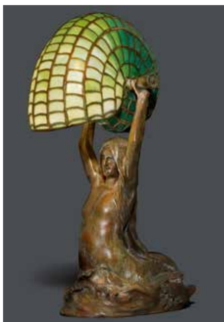
TIFFANY STUDIOS N.Y. Lampe „Nautilus / Mermaid“ Vers 1910. CHF 35 000 - 45 000.