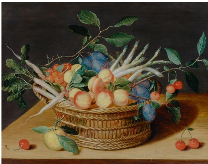
Isaac Soreau. Nature morte aux fruits et légumes dans une corbeille. Huile sur panneaux. 40,5 x 51,4 cm. CHF 150 000 / 250 000

Koller Auctions mettra à disposition la collection de Marie Teres Schmitz-Eichhoff les 19 et 23 septembre. L'œil discernant du collectionneur de Cologne était éclectique mais le noyau de sa collection consiste en des toiles de Maîtres Anciens et de la faïence baroque en trompe l'œil.