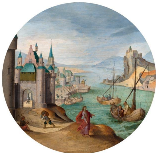
Abel Grimmer. Cinq allégories des mois de l'année. Huile sur panneau. Diam. 25 cm. CHF 90 000 – 140 000 chacun

Natures mortes hollandaises rares et une œuvre importante de la renaissance italienne