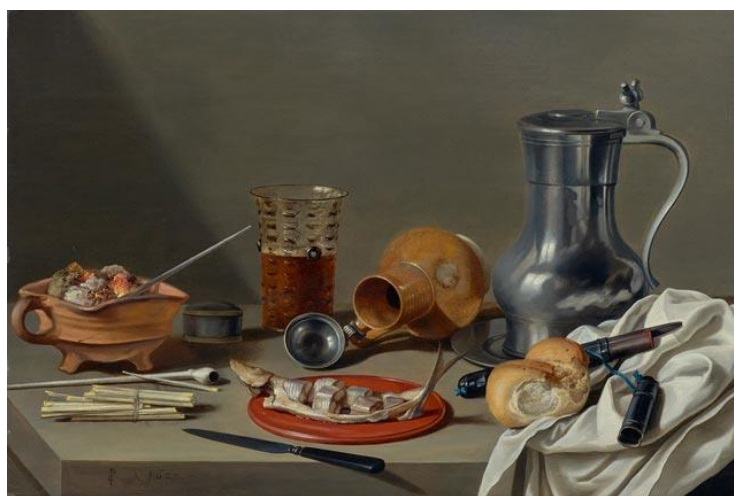
Pieter Claesz. Nature morte aux accessoires de fumeur. 1627. Huile sur panneau. CHF 500 000 – 700 000

La suite de tondi allégoriques représentant les mois de l'année par le Maître anversois Abel Grimmer (vers 1570-1620) est rarement apparue sur le marché. Alors que seulement trois séries complètes des douze mois sont connues, Koller a l'honneur de proposer à la vente un lot de cinq mois, à savoir février, mars, avril, octobre et décembre. Cet ensemble de peintures pourrait venir compléter presque totalement un autre lot de Grimmer vendu récemment sur le marché français (seul le mois de novembre manquerait). Conservées auprès de la même famille pendant plus de 300 ans, les cinq compositions seront mises en vente le 23 septembre avec une estimation globale de CHF 500 000 à 700 000 (lots 3033A-3033E).