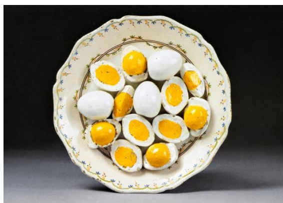
Assiette en faïence trompe l'oeil, France, milieu du 18e siècle. CHF 4 000 – 6 000.

La période baroque se distinguait par ses festins somptueux, du fait de l'attraction de la haute société européenne pour des décors de tables extravagants. Les céramiques en trompe l'œil étaient les pièces maîtresse de ces tables, et les invités adoraient contempler ces assiettes ornées de faux légumes et de fruits, des soupières en forme de choux, ainsi que des terrines aux formes diverses et variées. Parmi les highlights de la collection, on retrouve une collection datant du milieu du 18 e siècle avec une assiette en trompe l'œil décoré avec des œufs (lots 1751, CHF 4 000- 6 000) ; une paire de confiturier (lot