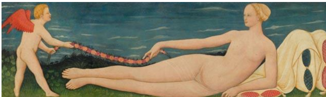
Paolo Schiavo. Venus et Cupidon. Vers 1440-45. Tempera sur panneau. 50,8 x 170 cm. CHF 250 000 – 350 000

Parmi les œuvres de grands peintres de la Renaissance italienne représentés à la vente tels que Tommaso di Credi, Giuliano di Amadeo et Andrea Manzini (connu sous le nom d'Andrea di Giusto), il faut mentionner un magnifique et rare panneau où l'on admire une Venus étendue jouant avec Cupidon dans un paysage peint par Paolo Schiavo (Florence 1397-1498 Pise). Autrefois dans la collection du J. Paul Getty Museum, cette œuvre a par la suite été incluse dans l'exposition "Art and Love in Renaissance Italy" au Metropolitan Museum of Art de New-York. Datant du début de la Renaissance, autour de 1440 -1445, sa première fonction était celle de décorer l'intérieur d'un coffre de mariage, dit cassone , servant à contenir le trousseau de la mariée, dont il ne persiste que très peu d'exemplaire aujourd'hui (lot 3013, CHF 250 000 – 350 000).