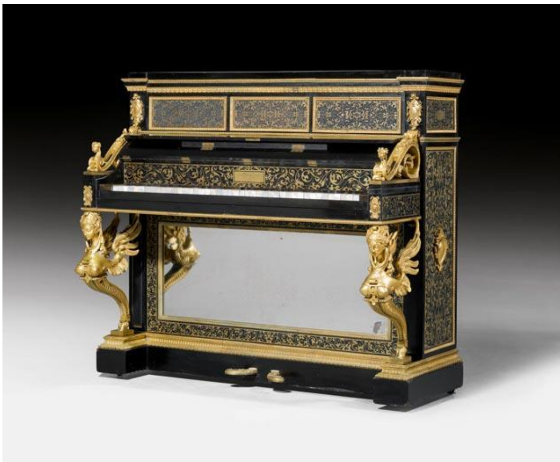
Piano debout "aux sphinges ailées" en marqueterie Boulle, Louis-Philippe. Signé Ignace Pleyel & Comp., pour le baron James de Rothschild. CHF 150 000 / 250 000.

Un piano pour le baron James de Rothschild