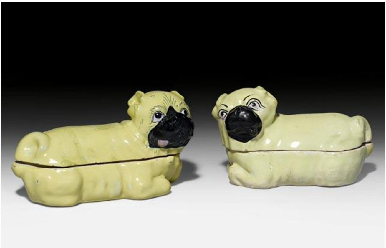
Une paire de terrines en forme de carlins, vers 1770. De la collection Schmitz-Eichhof, en vente le 19 septembre. CHF 1 500 – 2 500.

Des œuvres d'art provenant de musées seront mises en vente en septembre chez Koller Zurich. Un panneau exceptionnel représentant Vénus et Cupidon de Paolo Schiavo, anciennement dans la collection du J. Paul Getty Museum puis visible à l'exposition "Art and Love in Renaissance Italy" au Metropolitan Museum de New-York. Seront également offertes à la vente deux natures mortes de Georg Flegel et Isaac Soreau, présentées lors d'une exposition majeure, "Die Magie der Dinge" ("La Magie des Choses") à Bâle et Francfort en 2008-2009, ainsi que différentes pièces rares de porcelaine exposées à Cologne et Düsseldorf. Parmi les Highlights de la vente de mobilier ancien, un piano droit dessiné pour le baron James de Rothschild.