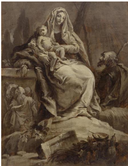
Giovanni Domenico Tiepolo, attribué à. Le repos pendant la fuite en Egypte. Vers 1745/50. Huile sur papier, marouflé sur toile. 39 x 30 cm. CHF 20 000 – 30 000.

Deux œuvres par Giovanni Domenico Tiepolo (1727 Venise 1804) seront présentées dans la vente de Dessins le 23 septembre : une huile sur papier illustrant la Fuite en Egypte (lot 3425, CHF 20 000- 30 000) et un dessin à l'encre brune d'un personnage debout en costume d'Orient (lot 3452, CHF 6 000-9 000). Les deux travaux sont remarquables de par leur spontanéité. L'étude à l'huile aurait pu servir soit de modèle pour l'atelier de Tiepolo ou directement pour la vente, puisqu'il y avait déjà un marché pour de telles études durant cette époque. Une étude similaire se trouve dans la collection du Kunsthaus Zurich.