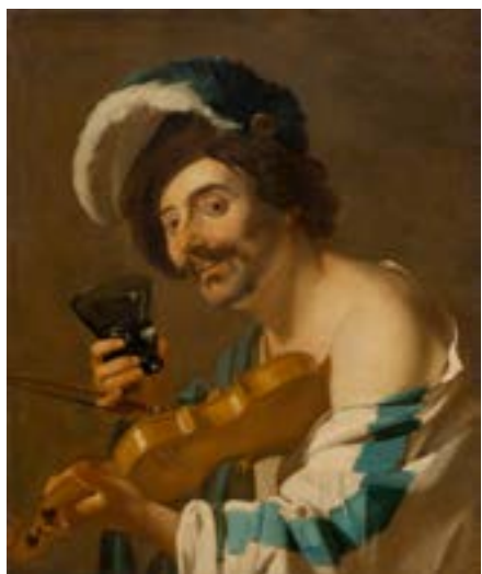
3037 DIRCK VAN BABUREN