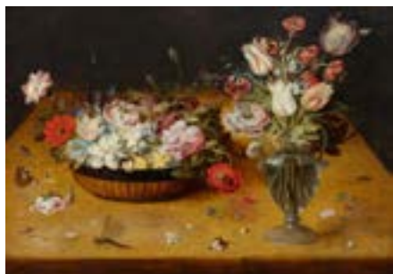
3034 OSIAS BEERT L'ANCIEN

D'importants tableaux qui font leur apparition sur le marché après avoir passé des décennies dans des collections privées, passeront en vente chez Koller à Zurich au mois de septembre lors des enchères de tableaux de maîtres anciens et de tableaux du XIXème siècle. Les temps forts de ces ventes aux enchères seront marqués, d'une part, par deux peintures flamandes : une magnifique nature morte aux fleurs, œuvre de l'un des plus grands maîtres du genre, Osias Beert l'Ancien et une œuvre rare de Dirck van Baburen, un peintre flamand fortement empreint du style du Caravage ; puis d'autre part, par deux importantes toiles du grand peintre russe de marines Ivan Konstantinovich Aivazovsky.