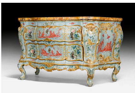
1018 COMMODO VÉNITIENNE À DÉCOR POYCHROME "AU DECOR CHINOIS" Louis XV, vers 1730/40. Vendue pour CHF 408 500

Les lots phare étaient deux kovsh (récipients à boire) du 17e siècle en argent partiellement doré, offerts par les tsars à leurs sujets afin de récompenser leurs bons et loyaux services. L'un avait été offert par le tsar Alexis, et l'autre par Ivan V et Pierre le Grand. De tels présents royaux sont pratiquement impossibles à trouver en dehors des musées aujourd'hui. Les deux kovsh ont atteint CHF 164 900 et CHF 152 900, plus de quatre fois leurs estimations.