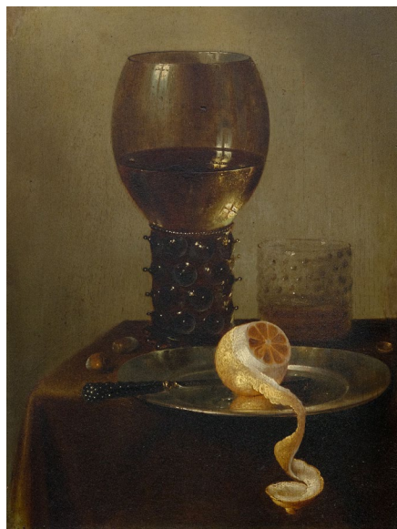
3022 WILLEM CLAESZ. HEDA (1594 Haarlem 1680) Nature morte avec Römer, assiette en étain et citron pelé. 1634. Huile sur panneau. 41 x 31 cm. Vendu pour CHF 198 500