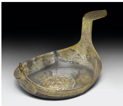
1179 KOVSH DE PRÉSENTATION D'IVAN V. ET PIERRE LE GRAND Moscou, 1681/82. Argent partiellement doré, avec une inscription des deux Tsars. Vendu pour CHF 152 900