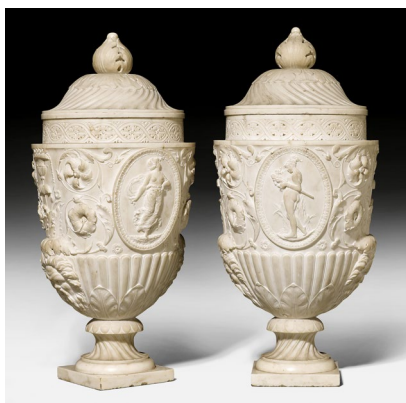
1416 PAIRE DE VASES "A L'ANTIQUE" Louis XVI, d'après des dessins préparatoires de G.B. Piranèse, Italie vers 1780/1800. Vendue pour CHF 132 500