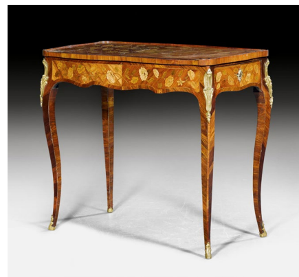
1397 BUREAU DE DAME "A FLEURS" Louis XV, attribué à Pierre Roussel, Paris vers 1760. Vendu pour CHF 101 300