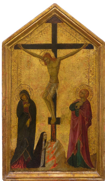
3004 NICCOLÒ DI SEGNA (actif à Sienne vers 1331-1348) Crucifixion. 1325-30. Tempera sur panneau, fond d'or. 35 x 21 cm. Vendu pour CHF 96 500