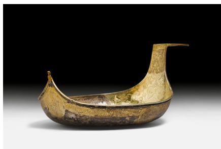
1178 KOVSH DE PRÉSENTATION D'ALEXIS 1er Russie, 1667/68. Argent partiellement doré, avec une inscription de la part d'Alexis 1er. Vendu pour CHF 164 900