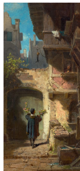
3218 CARL SPITZWEG (1808 Munich 1885) Der Gratulant. Vers 1860. Huile sur panneau. 28,6 x 14,2 cm. Vendu pour CHF 300 500