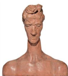
WILHELM LEHMBRUCK Buste de jeune homme ascendant. 1913. Pierre moulée, réalisée du vivant de l'artiste. Hauteur : 53,3 cm. Vendu pour CHF 324 500