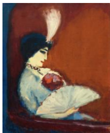
KEES VAN DONGEN Portrait de femme. Vers 1913. Huile sur toile. 65 x 55 cm. Vendu pour CHF 240 500