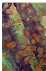
KATHARINA GROSSE 1020S. 2006 Acrylique sur toile. 142x82 cm. Vendu pour CHF 58 100