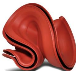
TONY CRAGG Red Square. 2007. Bronze coloré. 70 x 80 x 66 cm. Vendu pour CHF 144 500