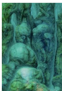
H. R. GIGER Lord of the rings I. 1975 Acrylique sur papier sur bois. 100 x 70 cm Vendu pour CHF 144 500