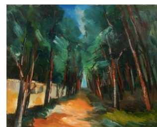
MAURICE DE VLAMINCK L'Allée. Vers 1912-14. huile sur toile. 66 x 81 cm Vendu pour CHF 204 500