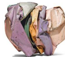
JOHN CHAMBERLAIN Kiss #18. 1979. Métal peint. 68,5 x 59,5 x 61 cm. Vendu pour CHF 526 500