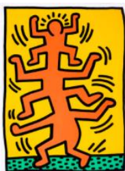
KEITH HARING Growing 1988 Sérigraphies en couleur. AP 2/15 Vendu pour CHF 58 100