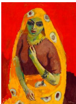
Kees Van Dongen L'Égyptienne. 1910-11. Öl auf Leinwand. 100 x 73 cm Vendu pour CHF 1,7million

Les ventes aux enchères de la maison Koller des 29 et 30 juin dernier ont été marquées par une grande effervescence lors de la mise en vente des œuvres d'art moderne et d'art contemporain - qui se sont souvent vendues à des prix dépassant de loin leurs estimations. Les deux jours d'enchères se sont clos sur un total de vente qui laisse loin derrière lui les estimations de prévente.