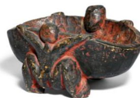
ERNST LUDWIG KIRCHNER Obstschale II. Vers 1910. Bois peint en rouge. Monogrammé sur la base : ELK. 17 x 38 x 24 cm. Vendu pour CHF 186 500