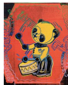
ANDY WARHOL Clockwork Panda Drummer (de la Toy Series). 1983. Polymère synthétique et sérigraphie sur toile. 35,5 x 27,7 cm. Vendu pour CHF 192 500