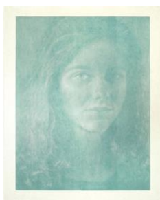
FRANZ GERTSCH Dominique. 1988. Gravure sur bois en couleurs. 7/18. Sur japon de Heizoburo 275 x 219 cm. Vendu pour CHF 168 500