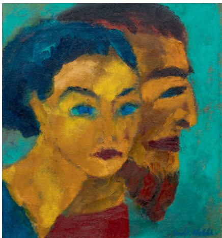
3222 EMIL NOLDE Doppelbild (Sie seltsames Licht). 1918. Öl auf Leinwand. 60,6 x 56,2 cm. Ergebnis: CHF 1 Million

tergänge, gemalt von Adolf Dietrich und Felix Vallotton; beide Gemälde wurden an Schweizer Privatsammlungen vermittelt. Das Dietrich-Gemälde Abendstimmung am Untersee , 1926, konnte bei einem Zuschlag bei CHF 480'000 seine Schätzung mehr als verdoppeln. Vallottons Coucher de soleil jaune et vert von 1911, taxiert auf CHF 700'000, erzielte einen Preis von CHF 883'000. Der farbenfrohe Blick auf das Val Bregaglia von Giovanni Giacometti verdoppelte seine mittlere Schätzung und konnte für CHF 312'000 veräussert werden.