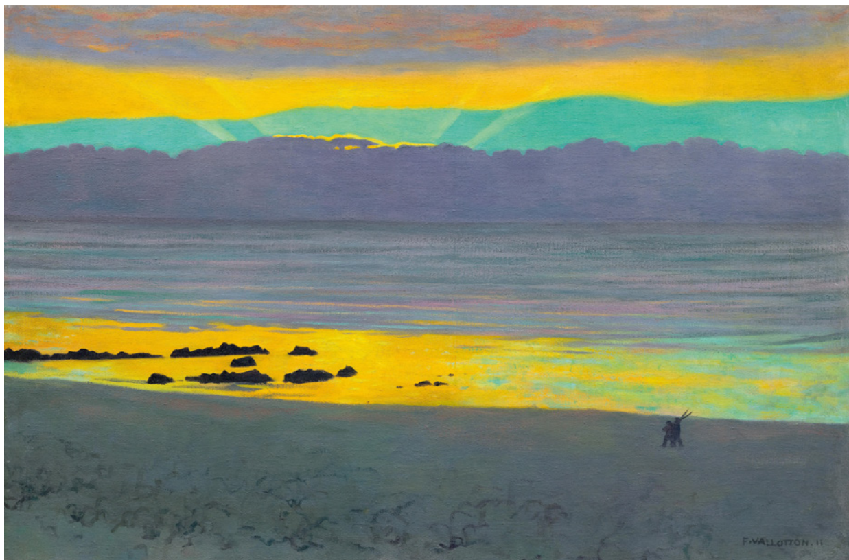
3029 FELIX VALLOTTON Coucher de soleil jaune et vert. Öl auf Leinwand. 54 x 81 cm. Ergebnis: CHF 883 000