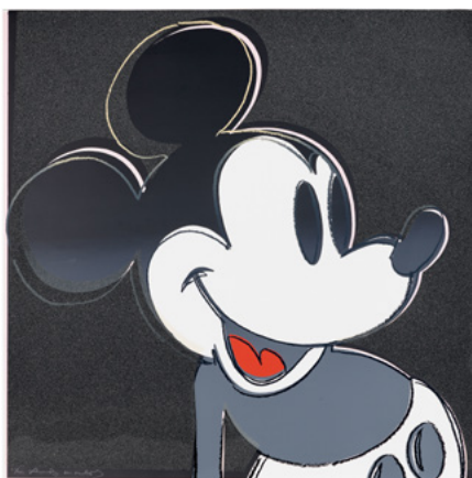
3420 ANDY WARHOL Mickey Mouse. 1981. Farbsiebdruck mit Diamantstaub. 96,5 x 96,5 cm. Ergebnis: CHF 96 000 Weltrekord