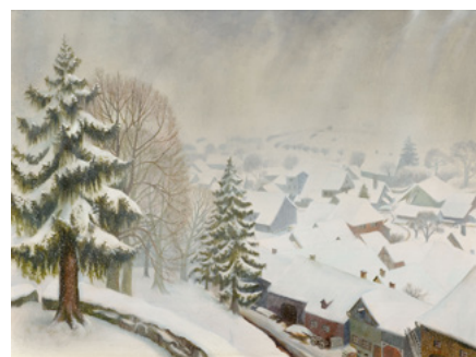
3217 OTTO DIX Wintertag in Randegg. 1933. Mischtechnik auf Holz. 60 x 80 cm. Ergebnis: CHF 174 000