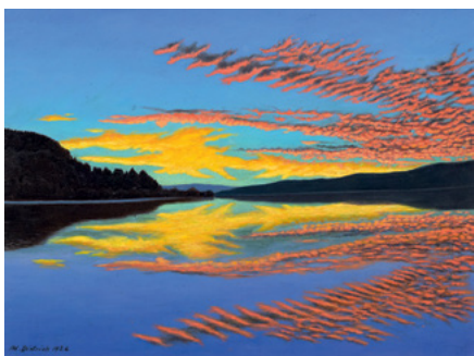
3038 ADOLF DIETRICH Abendstimmung am Untersee. 1926. Öl auf Karton. 32,7 x 42,9 cm. Ergebnis: CHF 480 000