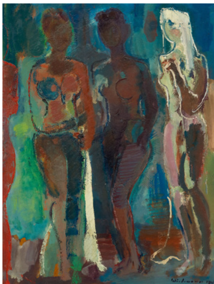
3235 GUILLERMO WIEDEMANN Nocturno. 1947. Öl auf Karton. 80 x 60 cm. Ergebnis: CHF 77 000 Weltrekord