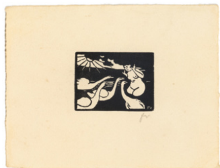
3601 FELIX VALLOTTON Les Petites Baigneuses (Detail), 1893. Portfolio mit 10 Holzschnitten. 12 x 16,5 cm. Ergebnis: CHF 168 000 Weltrekord