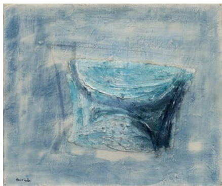
3406 JEAN FAUTRIER La passoire. 1947. Huile sur papier sur toile. 46 x 55 cm.