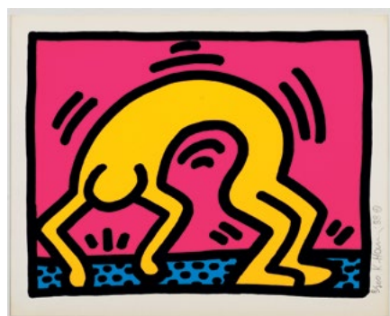
3791 KEITH HARING Pop Shop II. 1988. Lot de 4 sérigraphies en couleur. 8/200. 30,5 x 38 cm.