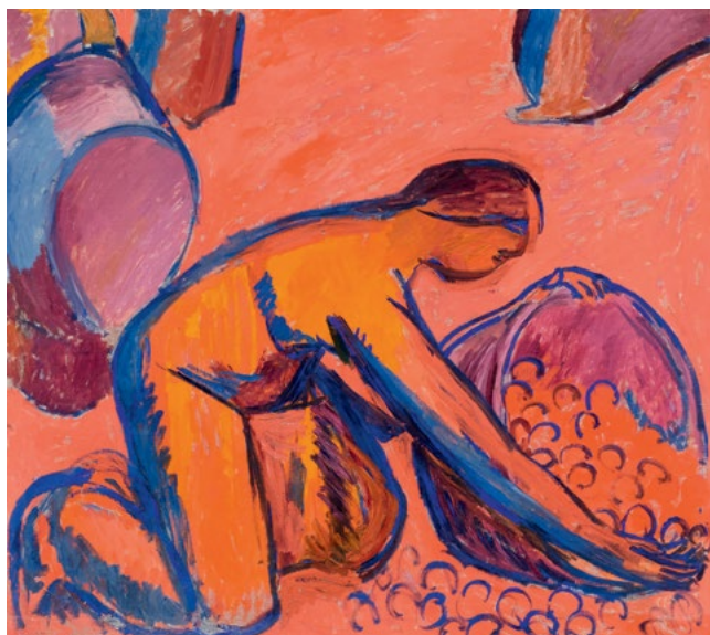
3082 CUNO AMIET La récolte de fruits. 1912. Huile sur toile. 103 × 115,5 cm.