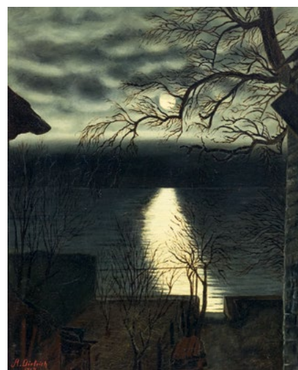
3069 ADOLF DIETRICH Pleine lune au-dessus de l'Untersee. 1919. Huile sur Pavatex. 31 x 26 cm.