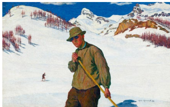
3052 GIOVANNI GIACOMETTI Skieur. 1899. Huile sur toile. 65,5 × 102 cm.