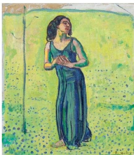
3057 FERDINAND HODLER La marcheuse. Vers 1910. Huile sur toile. 46,5 x 40 cm.