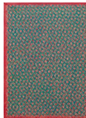
3483 PIERO DORAZIO Mimet. 1962. Huile sur toile. 46 x 33 cm.