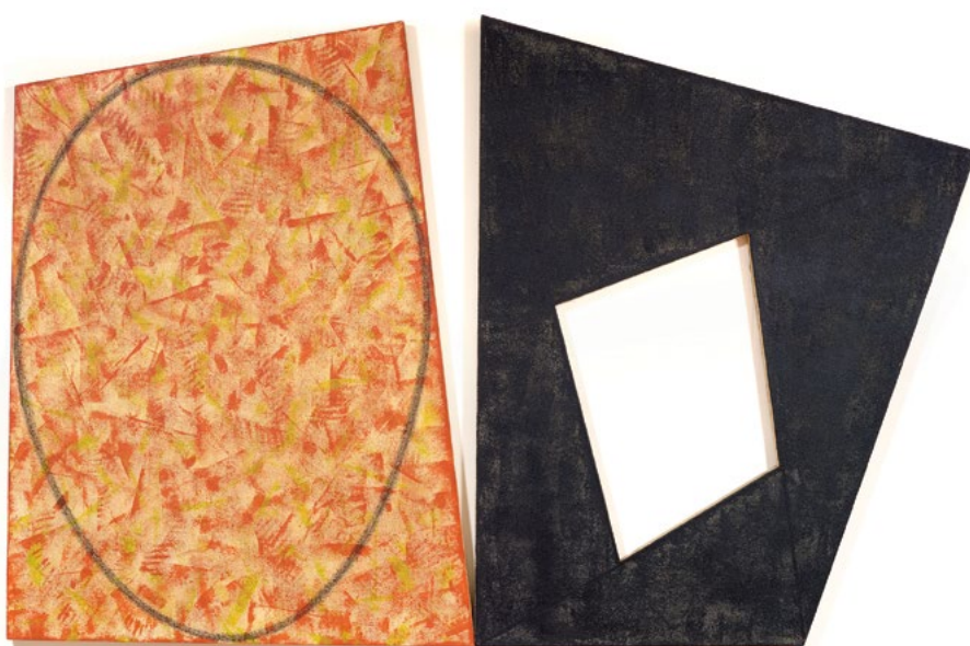
3502 ROBERT MANGOLD Red with Green Ellipse / Black Frame. 1988/89. Acrylique et crayon sur toile, en deux parties. 140 × 210 cm.

La vente d'art suisse du 28 juin présentait des œuvres de presque tous les plus grands noms de la peinture suisse des XIXe et XXe siècles. Plusieurs œuvres de Cuno Amiet de la collection Loeb ont été proposées, dont une «Récolte de fruits» de 1912, qui s'est vendue pour CHF 775'000, et un paysage printanier de 1938 qui a rapporté CHF 98'000. Giovanni Giacometti peint «Skieur» en 1899, mais son aspect extrêmement moderne a contribué à faire doubler le prix de vente, à CHF 488'000. Le Panorama de cinq mètres de Giacometti de Muottas Muragl n'a pas atteint son prix de réserve lors de la vente aux enchères, mais Koller est en négociation après-vente avec un acheteur pour cette œuvre majeure. Deux œuvres anciennes et significatives du peintre autodidacte Adolf Dietrich, «Nuages rouges le soir au lac» et «Pleine lune au-dessus de l'Untersee» ont rapporté CHF 183'000 et 171'000. Une vue de ferme du peintre appenzellois Johann Jakob Heuscher a été vendue dix fois son estimation supérieure et a établi un nouveau record pour l'artiste à CHF 51 000.