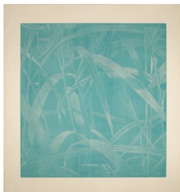
3747 FRANZ GERTSCH Herbes I. 2000. Gravure sur bois en couleur, ea 4/7. 172 x 153 cm.