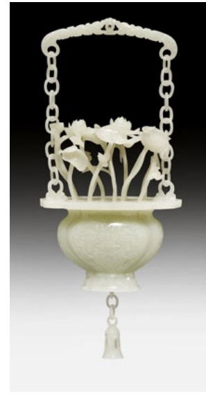
226 FEINES LOTOS-BOUQUET China, 19. / 20. Jh. H 36 cm. Aus exquisiter weisser Jade.