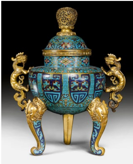
205 PRÄCHTIGES CLOISONNÉ-RÄUCHERGEFÄSS China, Qianlong-Periode. H 53 cm.