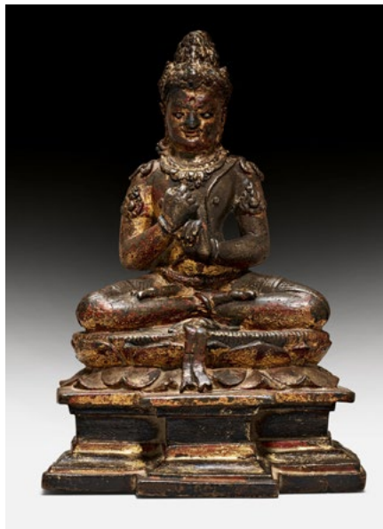
454 SCULPTURE EN BRONZE DE MAHAVAIROCANA Java centrale, IXe/Xe siècle. H 21 cm.