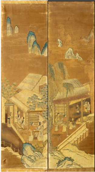
275 DEUX PANNEAUX EN BRODERIE Chine, XVIIIe siècle. 137,5 x 37,5 cm.