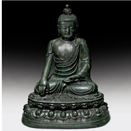
183 SCULPTURE EN BRONZE DU BOUDDHA SHAKYAMUNI Chine, dynastie Ming, datée 6ème année de Chenghua (1471). H 41 cm.