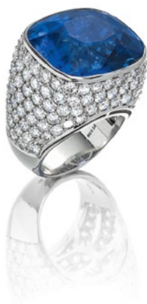
2222 BURMA-SAPHIR-BRILLANT-RING Besetzt mit 1 antik-ovalen Burma-Saphir von 37.67 ct, unerhitzt.