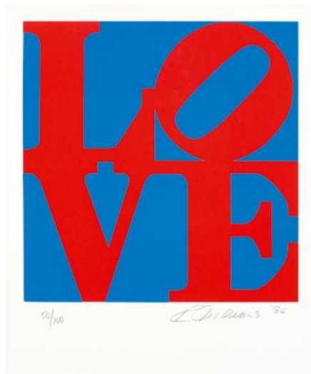
3716 ROBERT INDIANA The Book of Love. 1996. Portfolio mit 12 Farbserigrafien und 12 Gedichten.