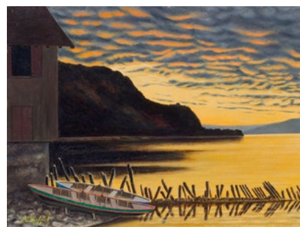
3061 ADOLF DIETRICH Abendstimmung am See mit Wolken. 1918. Öl auf Karton. 29 × 36,5 cm.