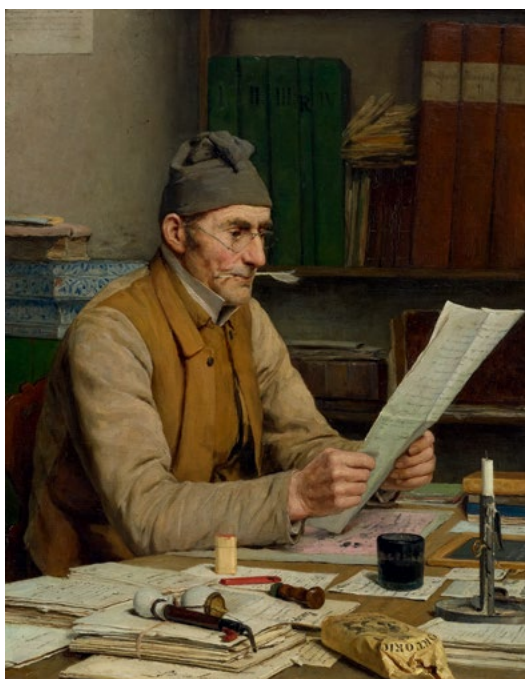
3013 ALBERT ANKER Der Gemeindeschreiber V. 1899. Öl auf Leinwand. 62,5 × 49 cm.

Die Selektion der Auktion Prints & Multiples wurde von Andy Warhol's "Superman", einer Farbserigrafie mit Diamantstaub aus dem Jahre 1981, angeführt (Lot 3709). Die Farbserigrafie erzielte mit CHF 183'000 ein starkes Resultat, gefolgt von Robert