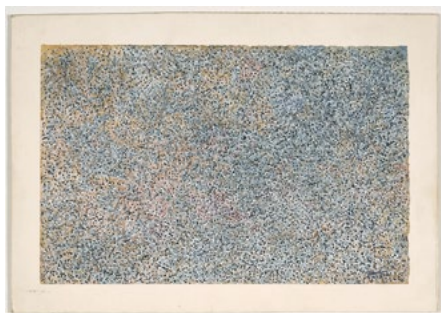
3409 MARK TOBEY Multi-Movements in Time. 1958. Tempera und Tinte auf Vélín. 16 × 25 cm.