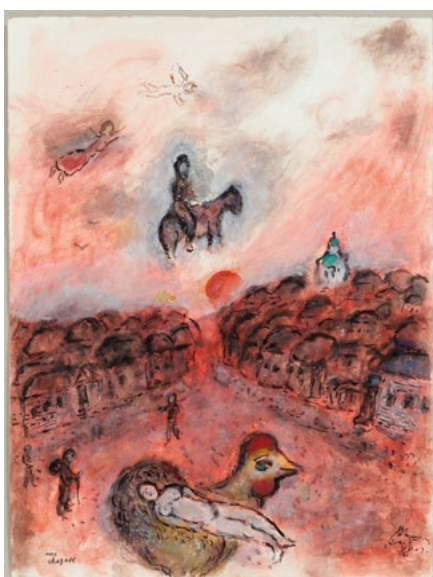
3249 MARC CHAGALL Repos sur coq et chevauchée au village rouge. 1975-78. Gouache, Tempera und Tusche auf Papier. 65,3 x 50 cm.