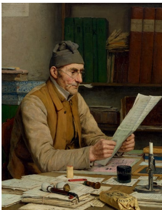
3013 ALBERT ANKER Le secrétaire communal V. 1899. Huile sur toile. 62,5 × 49 cm.

Le résultat phare des Estampes & Multiples est une sérigraphie en couleur avec poussière de diamant d'Andy Warhol représentant Superman, 1981 (lot 3709), vendue pour CHF 183'000, suivie par «The Book of Love» de Robert Indiana, dans laquelle le logo iconique LOVE est répété douze fois accompagné de poèmes (lot 3716, CHF 134'000). Dans l'ensemble, la vente aux enchères d'Estampes & Multiples a obtenu un résultat des plus stimulants avec 126% de la valeur totale vendue (hors commission d'acheteur).