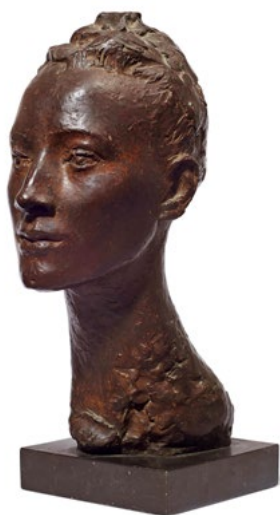
3226 GERMAINE RICHIER La Régodias (Renée Régodias). 1938. Bronze à patine brune. 40 × 17 × 20 cm.