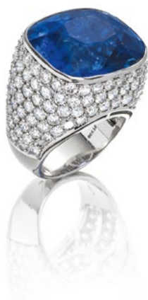
2222 BAGUE SAPHIR DE BIRMANIE ET DIAMANTS Sertie d'un saphir de Birmanie de 37.67 ct, non chauffé.