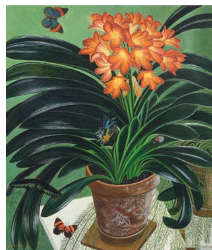
3037 ADOLF DIETRICH Clivia. 1943. Huile sur panneau. 65 × 57 cm.