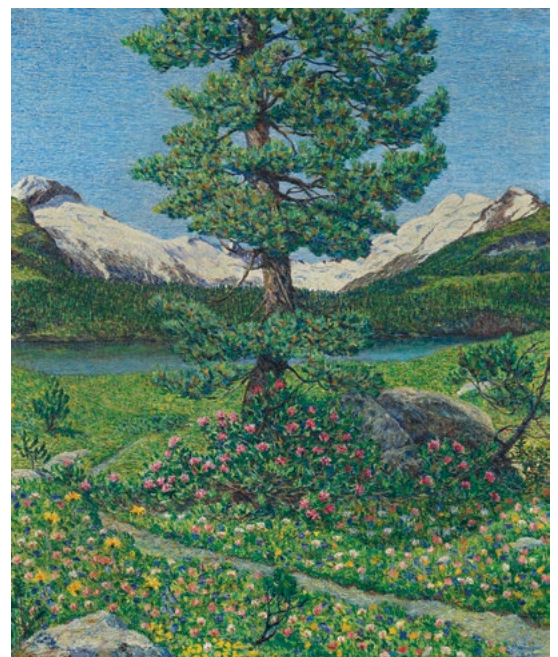
3066 GOTTARDO SEGANTINI Maloja "Paesaggio paradisiaco". 1920. Huile sur toile. 120 × 100 cm.