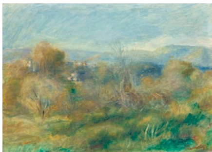
3211 PIERRE-AUGUSTE RENOIR Paysage, vallée village sur la hauteur et fond de montagnes. 1900. Huile sur toile. 26 × 36 cm.