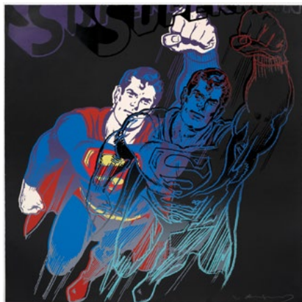
3709 ANDY WARHOL Superman. 1981. Sérigraphie en couleurs avec poussière de diamant. 8/200.