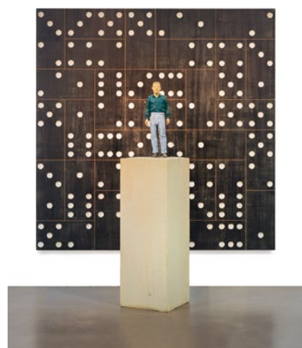
3517 STEPHAN BALKENHOL Homme à chemise verte et domino relief. 2007. Sculpture en bois de wawa peint. En deux parties.