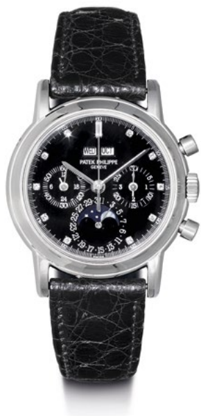
2892 PATEK PHILIPPE Chronographe à quantième perpétuel. 1998. Platine 950. Ref. 3970 E.