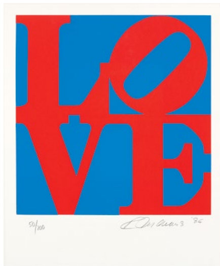
3716 ROBERT INDIANA The Book of Love. 1996. Portfolio avec 12 sérigraphies en couleurs et 12 poèmes. 50/200.