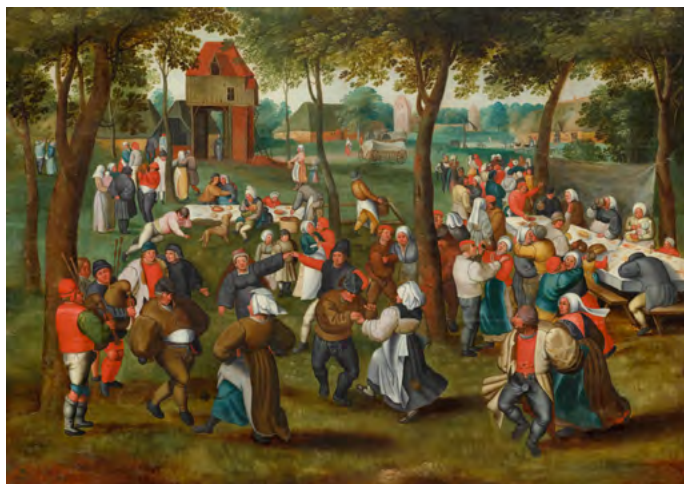
3021 MARTEN VAN CLEVE L'ANCIEN Mariage paysan en plein air. Huile sur panneau. 77 × 107,5 cm. Estimation : CHF 150 000/250 000 Vendu pour CHF 269 000