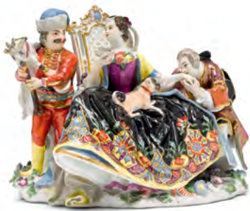
1542 IMPORTANT GROUPE EN PORCELAIN DE MEISSEN Vers 1737. Modèle de Johann Joachim Kändler. H 15,5 cm. Estimation : 50 000/70 000 Vendu pour CHF 214 000