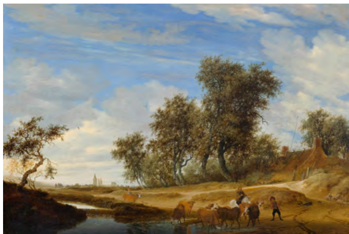
3045 SALOMON VAN RUYSDAEL Paysage avec groupe d'arbres. Huile sur panneau. 76,5 × 115 cm. Estimation : CHF 25 000/45 000 Vendu pour CHF 256 000