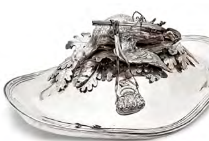
1132 UNE PAIRE DE TERRINES AVEC COUVERCLES Turin, 2 e moitié du 18 e siècle. 45 × 28,5 cm, Ensemble env. 11'110 g. Estimation : CHF 20 000/40 000 Vendue pour CHF 183 000