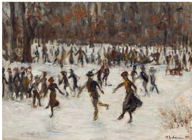
3122 MAX LIEBERMANN Patineurs au Tiergarten. 1921. Huile sur toile. 49 × 53 cm. Estimation : CHF 150 000/200 000 Vendu pour CHF 305 000