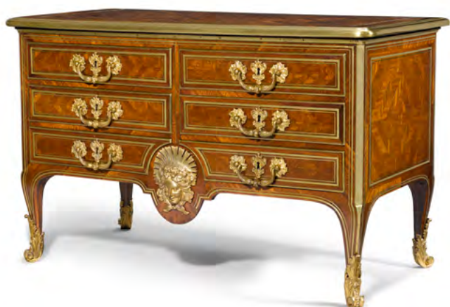
1040 LA COMMODE SECKENDORFF François Lieutaud, d'après des dessins de Jean Bérain. Régence, Paris vers 1728/30. 80 × 130 × 65 cm. Estimation : CHF 150 000/250 000 Vendue pour CHF 165 000