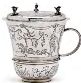
1531 TASSE À CHOCOLAT EN ARGENT Londres, vers 1680. Poinçon de maître Ralph Leake. H 11,8 cm. 300 g. Estimation : CHF 20 000/30 000 Vendue pour CHF 64 000