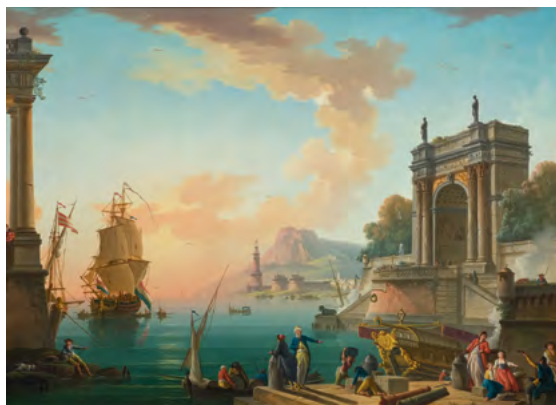
3073 CHARLES FRANÇOIS LACROIX DE MARSEILLE Pendants : Vue de ports méditerranéens. 1776. Huile sur toile. 106,7 × 146,5 cm / 108,3 × 149,3 cm. Estimation : CHF 200 000/300 000 Vendus pour CHF 220 000