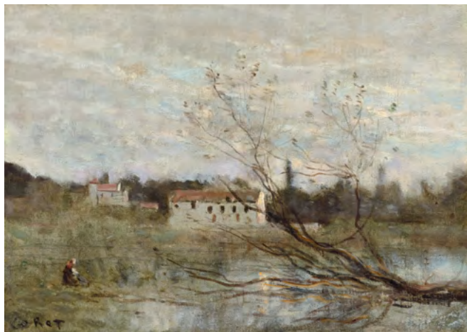
3114 JEAN-BAPTISTE CAMILLE COROT Ville d'Avray, un coin d'étang. 1865-70. Huile sur toile. 23,3 × 32,3 cm Estimation : CHF 20 000/30 000 Vendu pour CHF 200 000