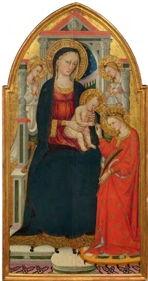
3007 BICCI DI LORENZO Mariage mystique de Sainte Catherine. Vers 1445–50. Tempera et or sur panneau. 165 × 98 cm. Estimation : CHF 250 000/350 000 Vendu pour CHF 342 000