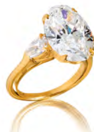
2166 BAGUE DIAMANTS, HARRY WINSTON, ca. 1968 Sertie d'un diamant ovale de 5,42 ct, E/VS2, avec deux diamants en forme de poire, ens. ca. 0,68 ct. Estimation : CHF 90 000/150 000 Vendue pour CHF 122 000

CHF 64 000. La famille Müller-Frei collectionnait également la porcelaine asiatique, les peintures anciennes et modernes ainsi que le mobilier de prestige et chacun de ces objets s'est particulièrement bien vendu, tel ce vase chinois en porcelaine fine «Doucai» (lot 1629), vendu CHF 208 000 (estimation CHF 30 000/50 000).