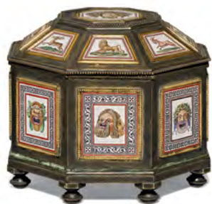
1202 BOÎTE OCTOGONALE À DÉCOR DE MICRO-MOSAÏQUE Italie, Rome vers 1870. Par Augusto Castellani. Estimation : CHF 12 000/18 000 Vendue pour CHF 156 000

Cette collection privée suisse, rassemblée avec amour pendant des décennies, a suscité un énorme intérêt parmi les enchérisseurs, en particulier pour ses pièces exceptionnelles de porcelaine de Meissen et d'argenterie anglaise. Un important groupe en porcelaine de Meissen, dit "à la crinoline" selon un modèle de Johann Joachim Kändler de 1737 environ (lot 1542, estimé CHF 50 000/70 000), a été vivement débattu entre les enchérisseurs au téléphone et en ligne avant d'être adjugé à CHF 214 000. Un autre groupe de Kändler représentant un couple amoureux avec une cage à oiseaux (lot 1550) a été vendu pour près de trois fois son estimation, à CHF 116 000. Une tasse à chocolat chaud en argent de Ralph Leake (lot 1531) a triplé son estimation inférieure en atteignant