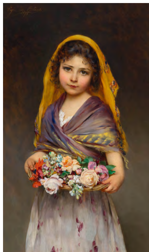
3210 EUGEN VON BLAAS Jeune fille avec corbeille de fleurs. 1898. Huile sur panneau. 81,6 × 49 cm Estimation : CHF 60 000/80 000 Vendu pour CHF 134 000