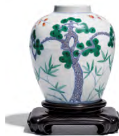
1629 VASE DOUCAI Chine, Yongzheng (1723-1735). H 13 cm. Estimation : CHF 30 000/50 000 Vendu pour CHF 208 000