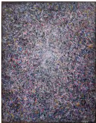
3710 MARC TOBEY Sans titre. 1960. Tempera sur vélin. 48,5 × 38 cm. Vendu pour CHF 132 000