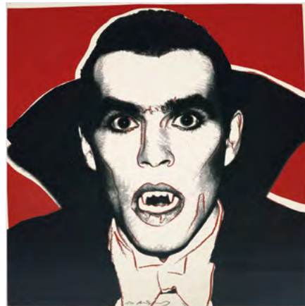
3865 ANDY WARHOL Dracula. 1981. Sérigraphie avec poussière de diamant. Pièce unique. 96,5 × 96,5 cm. Vendu pour CHF 116 000 Prix record