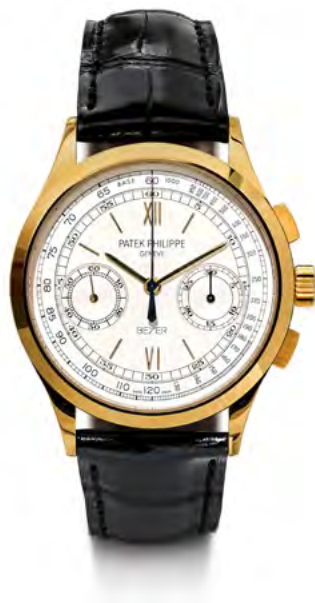
2907 PATEK PHILIPPE "Beyer jubilee chronograph". 2010. Or jaune 750. Réf. 5170. Vendue pour CHF 67 000