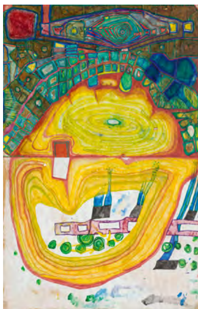
3724 FRIEDENSREICH HUNDERTWASSER Der gelbe Platz - Flugplatz. 1958. Aquarelle et vernis sur papier d'emballage. 98,5 × 64 cm. Vendu pour CHF 195 000