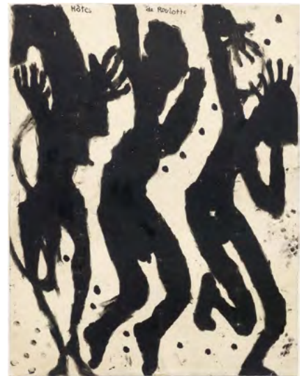
3341 LOUIS SOUTTER Hôtes de roulotte. 1937–42. Encre sur papier (peinture au doigt). 65 × 50 cm. Vendu pour CHF 171 000