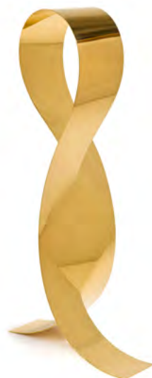
3702 MAX BILL Double surface comme hexagon. 1968. Laiton doré. 76 × 24 × 25 cm. Vendu pour CHF 58 000