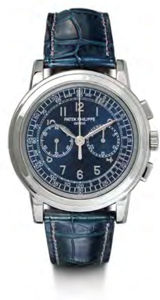
2908 PATEK PHILIPPE Chronographe, 2008. Platine 950. Réf. 5070 P. Vendue pour CHF 122 000