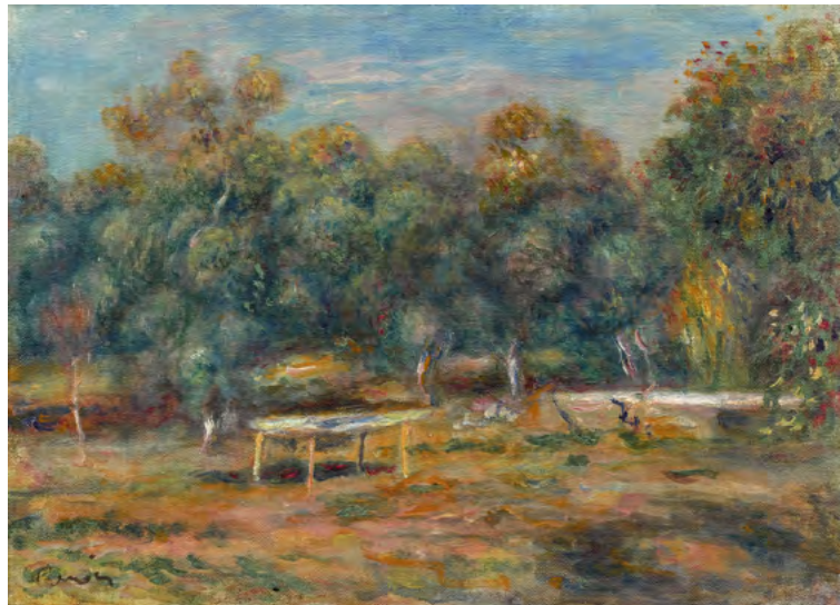
3506 PIERRE-AUGUSTE RENOIR Dans le jardin des Colettes à Cagnes. Circa 1910. Huile sur toile. 30,5 × 42,5 cm. Vendu pour CHF 360 000