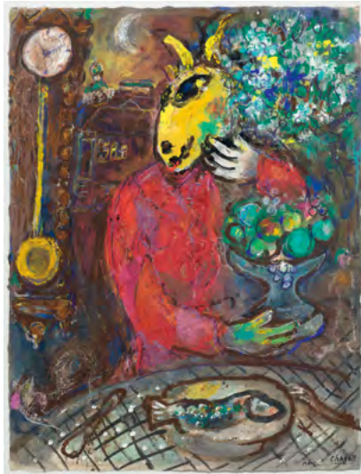
3540 MARC CHAGALL La veste rouge. 1961. Huile, gouache, encre sur papier. 66 × 50.5 cm Vendu pour CHF 342 000