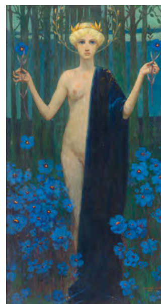
3501 MELCHIOR LECHTER Blaue Blume Einsamkeit (Fleurs bleues de solitude). 1892-93. Huile sur carton. 106 × 74 cm. Vendu pour CHF 128 000 Prix record