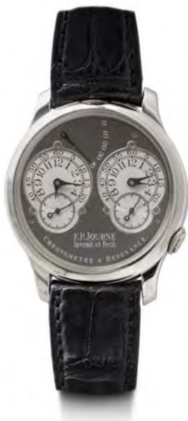
2861 F. P. JOURNE "Chronomètre à resonance", 2002. Platine 950. Vendue pour CHF 232 000