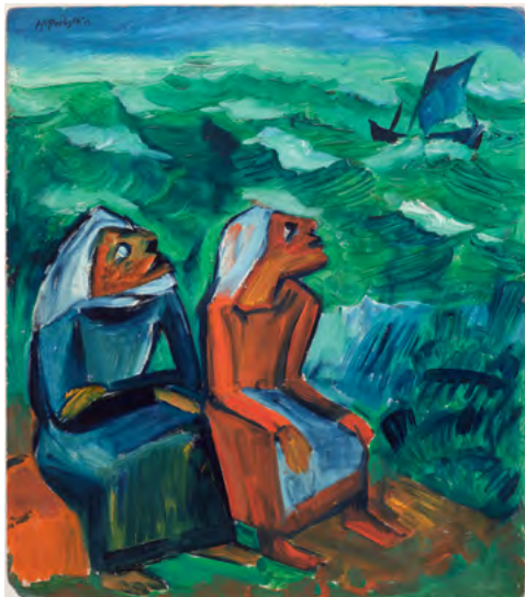
3523 HERMANN MAX PECHSTEIN Fischerfrauen (Femmes de pêcheurs). Vers 1920. Huile sur carton. 52,2 × 45,9 cm. Vendu pour CHF 342 000