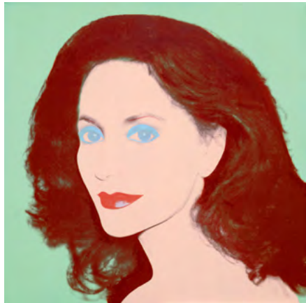
3752 ANDY WARHOL Lola Jacobsen. Sérigraphie et acrylique sur toile. 101,5 × 101,5 cm. Vendu pour CHF 208 000

Deux œuvres ont atteint des prix record dans cette même vente : une peinture symboliste de Melchior Lechter, "Solitude de la fleur bleue", 1892-93 (lot 3501), a pulvérisé les meilleurs résultats de vente précédents de l'artiste avec ses CHF 128 000, et un paysage d'hiver de l'artiste suédois Gustaf Fjaestad (lot 3502) a été vendu pour le montant record de CHF 98 000.