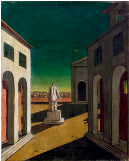
3553 GIORGIO DI CHIRICO Piazza d'Italia. 1945–49. Huile sur toile. 50 × 40 cm. Vendu pour CHF 220 000