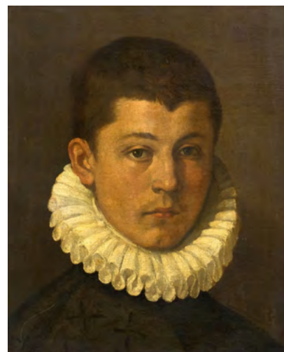
3036 ANNIBALE CARRACHE (cercle de) Portrait d'un jeune homme avec col en dentelle. Huile sur toile. 40,2 × 33,2 cm. Vendu pour CHF 226 000