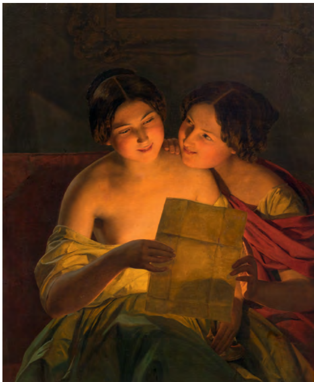
3141 FERDINAND GEORG WALDMÜLLER La lettre d'amour. 1848. Huile sur toile. 78 × 64,5 cm Vendu pour CHF 232 000