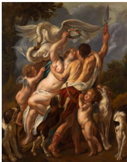
3046 JACOB JORDAENS Vénus et Adonis. Huile sur toile. 197,5 × 155 cm. Vendu pour CHF 183 000