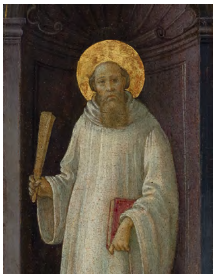
3002 FILIPPINO LIPPI Saint Benoît. Vers 1470–75. (détail) Huile et tempera sur panneau. 63,3 × 23,3 cm. Vendu pour CHF 134 000