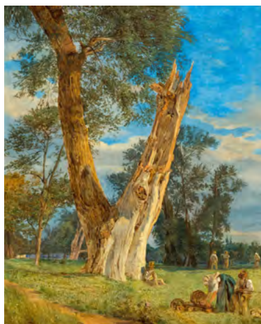
3152 FERDINAND GEORG WALDMÜLLER Personnages sur le Prater. 1833. Huile sur panneau. 31 × 25,5 cm. Vendu pour CHF 73 000