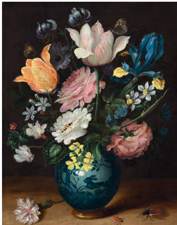
3026 JAN BRUEGHEL LE JEUNE Bouquet de fleurs dans un vase en porcelaine. Huile sur cuivre. 28,4 × 23,2 cm. Vendu pour CHF 122 000

Parmi les œuvres du 19 e siècle, «La lettre d'amour» de Ferdinand Georg Waldmüller , une représentation intimiste de deux jeunes femmes à la lueur d'une bougie, a été vendue pour CHF 232 000 à un collectionneur privé suisse (lot 3141). Un paysage avec des personnages de Waldmüller a atteint CHF 73 000 (lot 3152). Une vue de Capri aux couleurs vives de l'artiste russe expatrié Konstantin Gorbatoff a trouvé preneur pour plus du double de son estimation à CHF 134 000 (lot 3119), et un paysage fluvial paisible d' Eugène Boudin (lot 3135) a également doublé son estimation avec CHF 104 000.