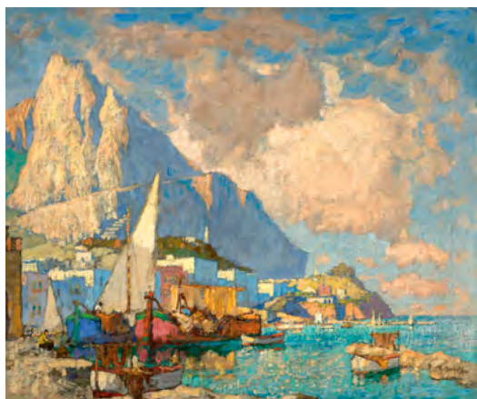
3119 KONSTANTIN IVANOVICH GORBATOFF Vue de Capri. Huile sur toile. 50,3 × 60,4 cm. Vendu pour CHF 134 000