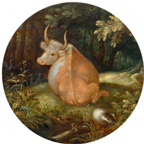
3022 ROELANT SAVERY Vache reposant dans un paysage. 1604. Huile sur panneau. D 17,5 cm. Vendu pour CHF 128 000

« Les résultats de cette vente, en particulier les enchères enthousiastes pour des œuvres telles que le van Dyck, confirment ce que nous constatons depuis un an : malgré les bouleversements mondiaux causés par la pandémie dans de nombreux secteurs, le marché des Maîtres Anciens - et le marché des ventes aux enchères en général - est en excellente santé, en particulier pour les œuvres de grande qualité », a commenté Cyril Koller, directeur de Koller Auctions.