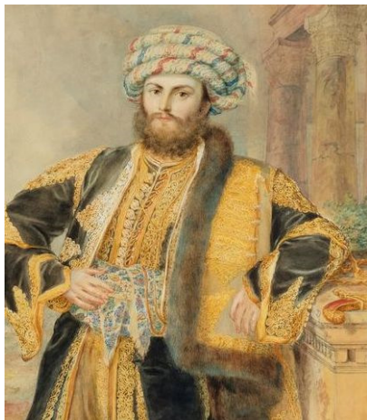
Portrait d'Alexandros Mavrokordatos, vendu CHF 30 500