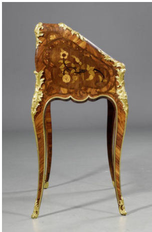
Bureau Louis XV attribué à J.-P. Latz, vendu pour CHF 192 500