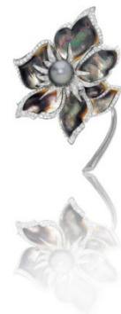
Broche avec perle et diamants, Chaumet, vendu CHF 17 300

Le lot phare de la vente de joaillerie est une bague en diamants avec un saphir birman de 13.70 ct. Il a atteint la somme de 160 000 (lot 2033). Les pièces signées Cartier, Chaumet et Bulgari ont perpétué la récolte de très hautes sommes, comme le magnifique lot de la couverture du catalogue, une broche florale en diamants avec une perle de Chaumet (lot 2032, CHF 17 300), ainsi qu'une bague en platine avec saphir et diamant signé Bulgari, qui a atteint la somme de CHF 48 500 (lot 2182).