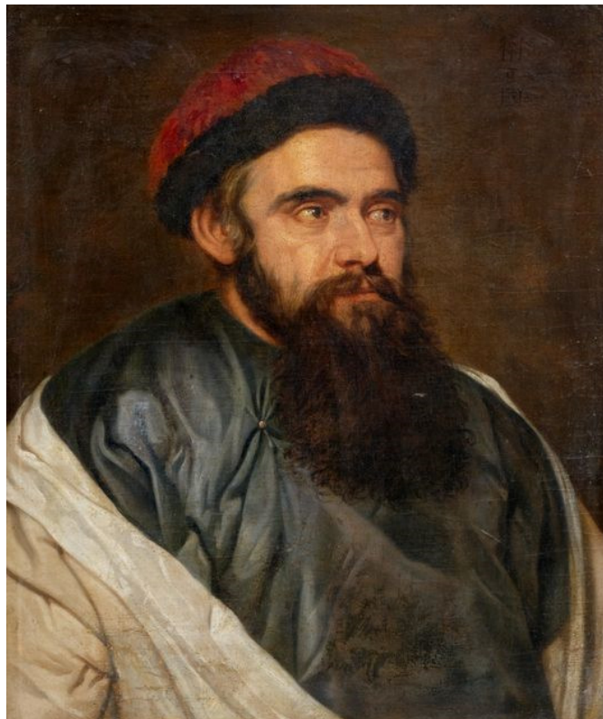
Michaelina Wautier, portrait de Martino Martini, vendu CHF 480 500 record mondial pour une œuvre de cette artiste vendue aux enchères

La semaine de ventes d'art ancien chez Koller a donné d'excellents résultats, notamment pour des œuvres d'artistes tels que Caspar David Friedrich et Osias Beert. Le sommet a été atteint avec un portrait de Michaelina Wautier, vendu pour près d'un demi-million de francs suisses, et engendre un nouveau record mondial pour cette artiste.