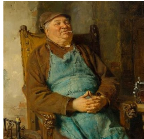
Eduard Grützner, vendu à CHF 67 700

Une série de portraits d'hommes dans des brasseries et caves à vin réalisée par l'artiste bavarois Eduard Grützner a largement dépassé les estimations initiales. Ainsi, la représentation d'un brasseur en train de savourer un moment de quiétude avec un cigare et une bière a été vendue à CHF 67 700 (lot 3209). Un paysage tardif de Jean-Baptiste Camille Corot, issu de la collection l'ingénieur ferroviaire écossais, James Staats Forbes, change de mains pour CHF 84 500 (lot 3214), tandis qu'une magnifique vue du Port de Marseille par Felix François Ziem (lot 3205) trouve acquéreur pour CHF 59 300.