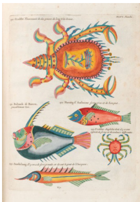
Louis Renard vendu CHF 90 500

polonais, ami d'enfance d'Auguste III (lot 1778, vendu pour CHF 30 500), ainsi qu'une terrine au décor de chinoïseries de forme inhabituelle (lot 1775) ayant atteint le prix remarquable de CHF 22 100.