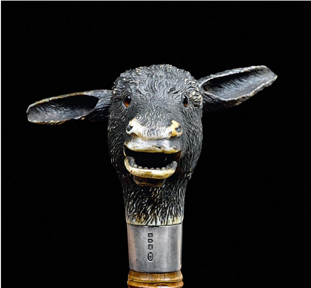
CANNE AUTOMATE, Brigg, Londres, 1896. Pommeau en ivoire polychrome représentant une tête d'âne bougeant les oreilles. CHF 3 000 – 4 000

CANNES ANCIENNES CHEZ KOLLER GENEVE Ventes aux enchères au Palais de l'Athénée à Genève